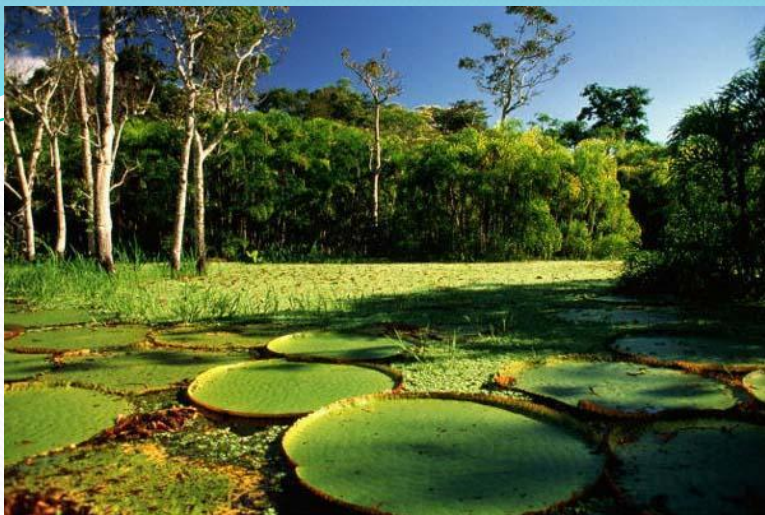
1. Южная Америка