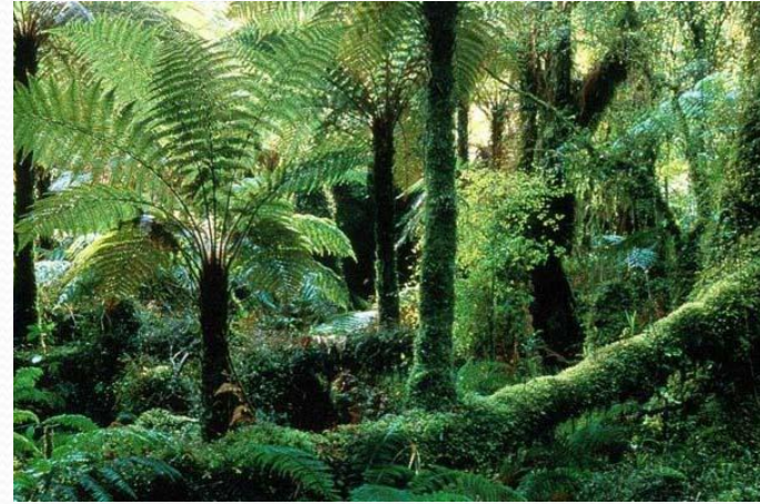
2. влажный тропический лес