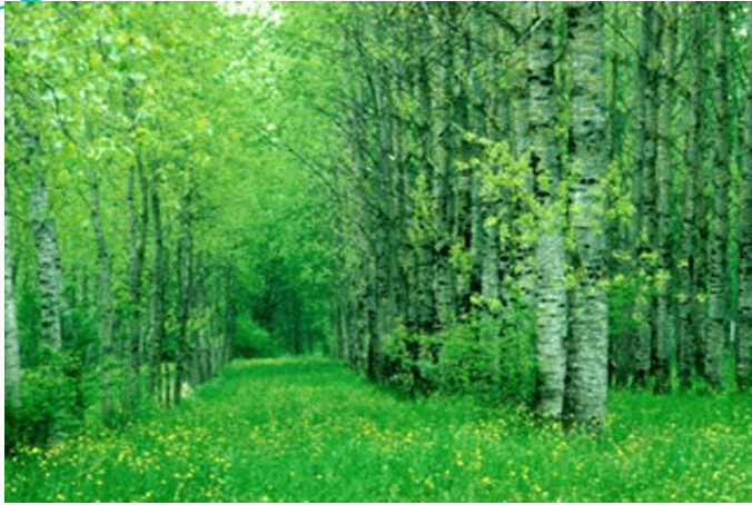
1. лиственный лес