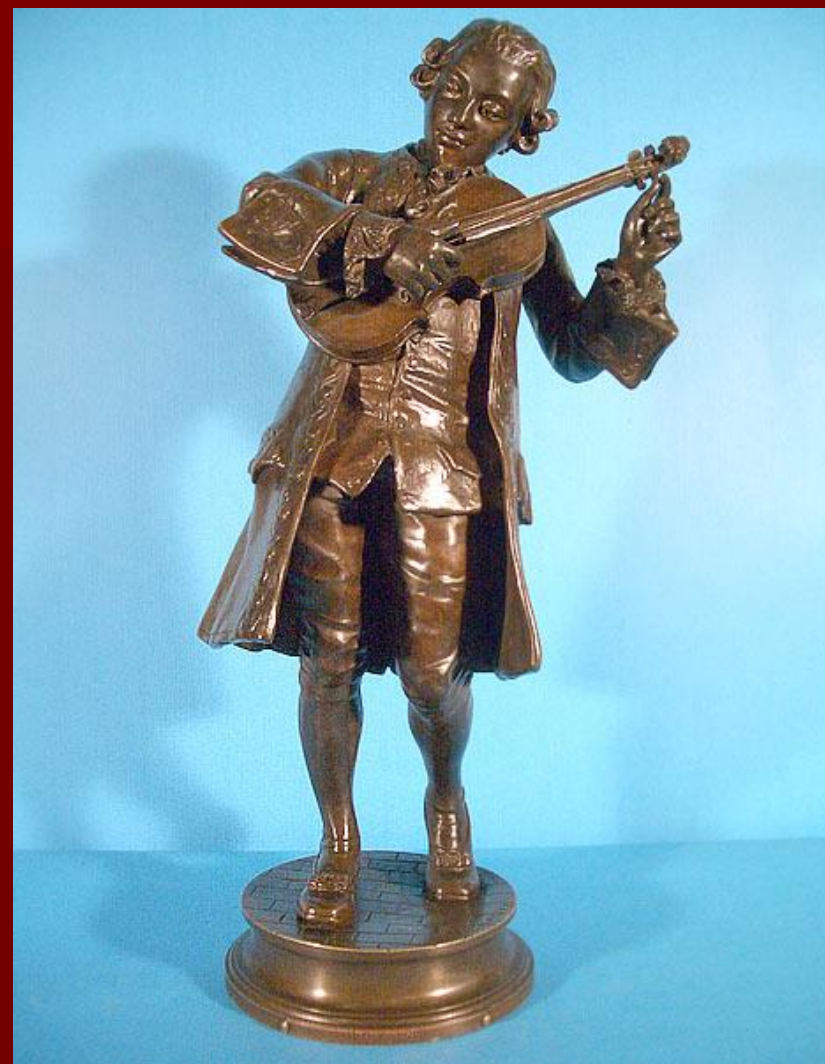
Бронзовые скульптуры Моцарта