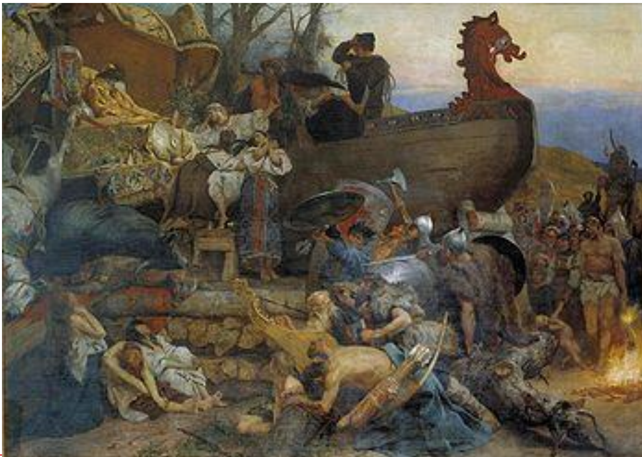
Г. Семирадский «Похороны знатного руса»