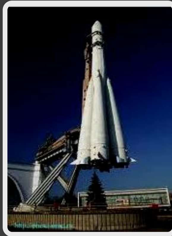
Первый полёт в космос