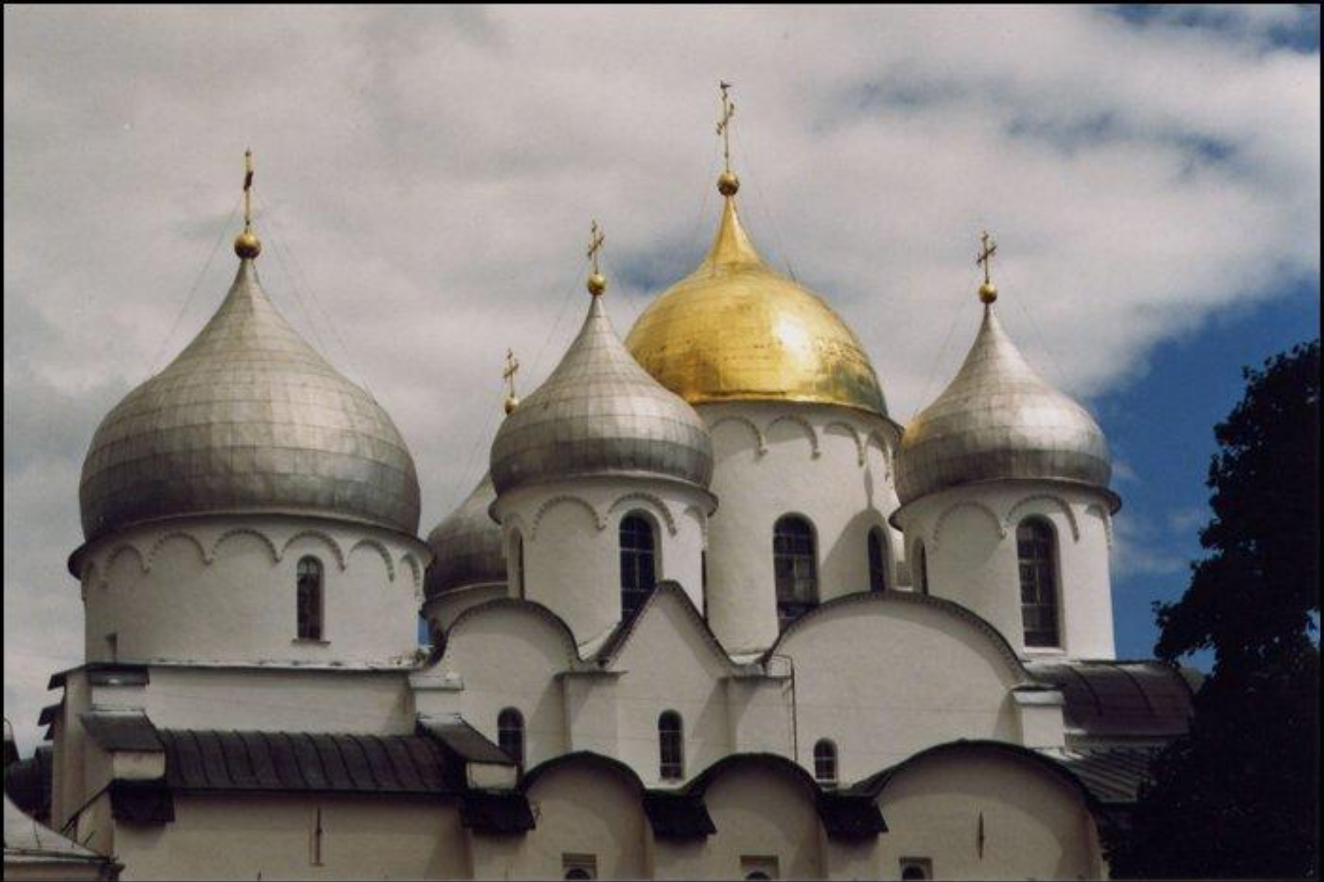
■ Купола Софийского собора