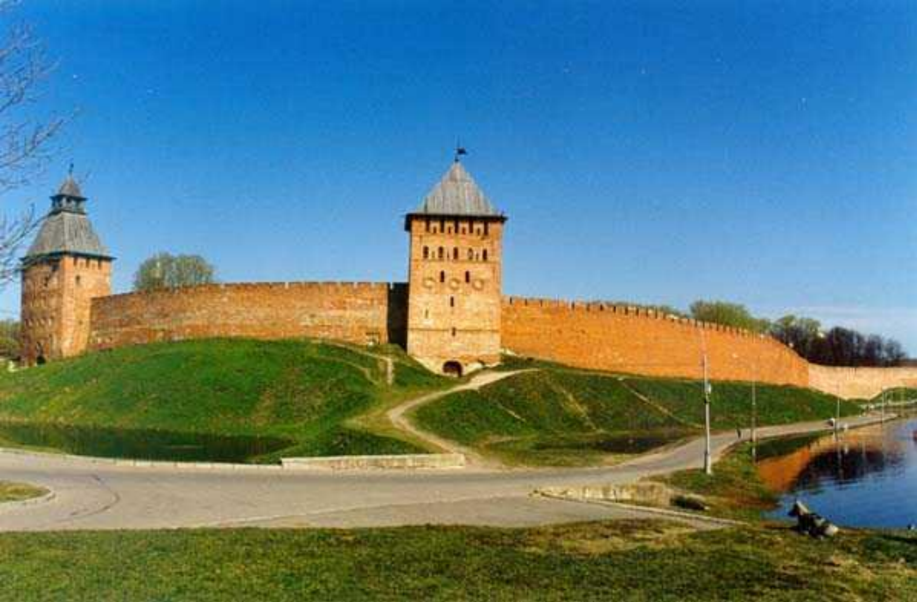
Башня Дворцовая. XV-XVII в.