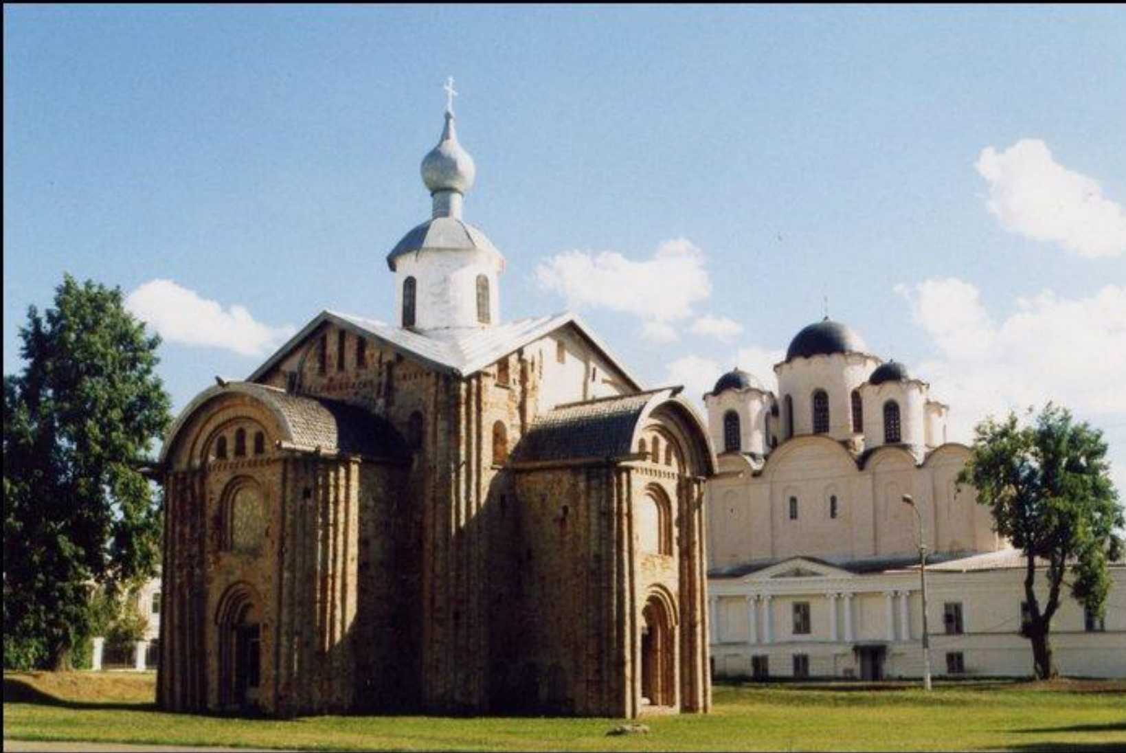
Церковь Параскевы Пятницы