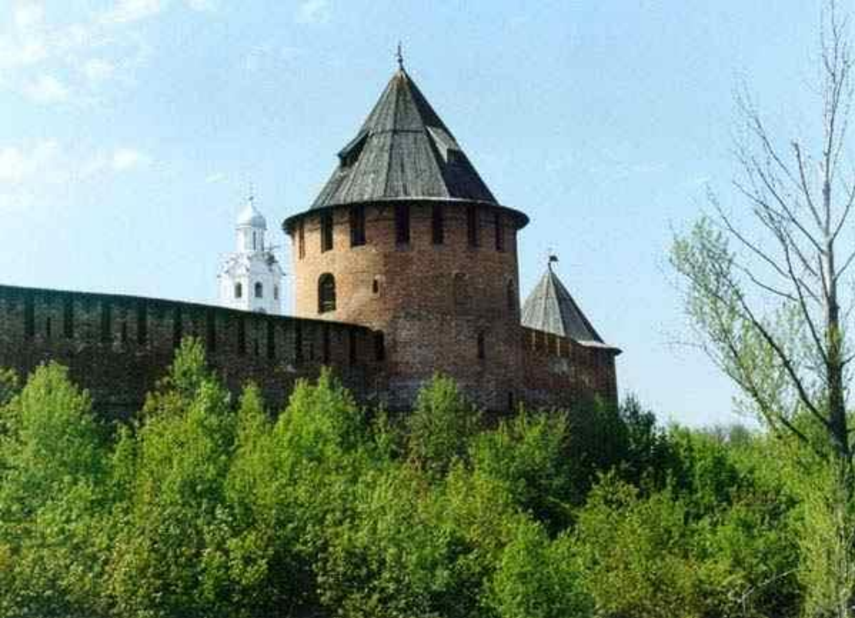
Башня Федоровская. XV-XVII в. Эта круглая башня в отличие от других башен Кремля не имеет украшений. В древности она использовалась для хранения боеприпасов.