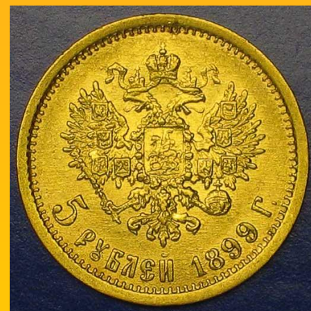
Золотые 5 рублей 1899 г. реверс