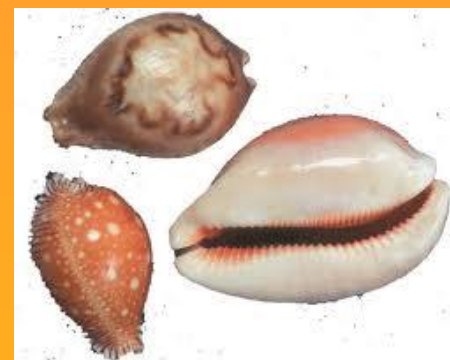
Раковины Каури (Приморье)