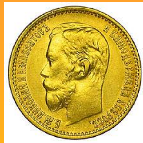
Золотые 5 рублей 1899 г. аверс