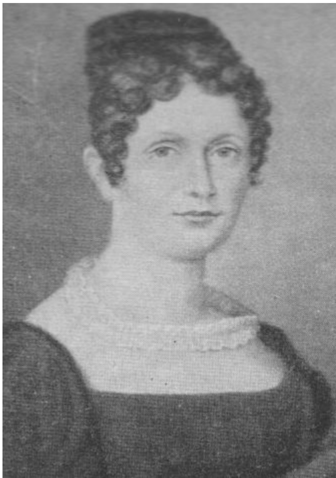
Иоганна Христиана Шуман