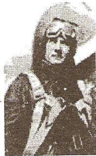
Борис Литвинчук после полета

Борис Литвинчук, герой Советского Союза, почетный гражданин г. Калуга.