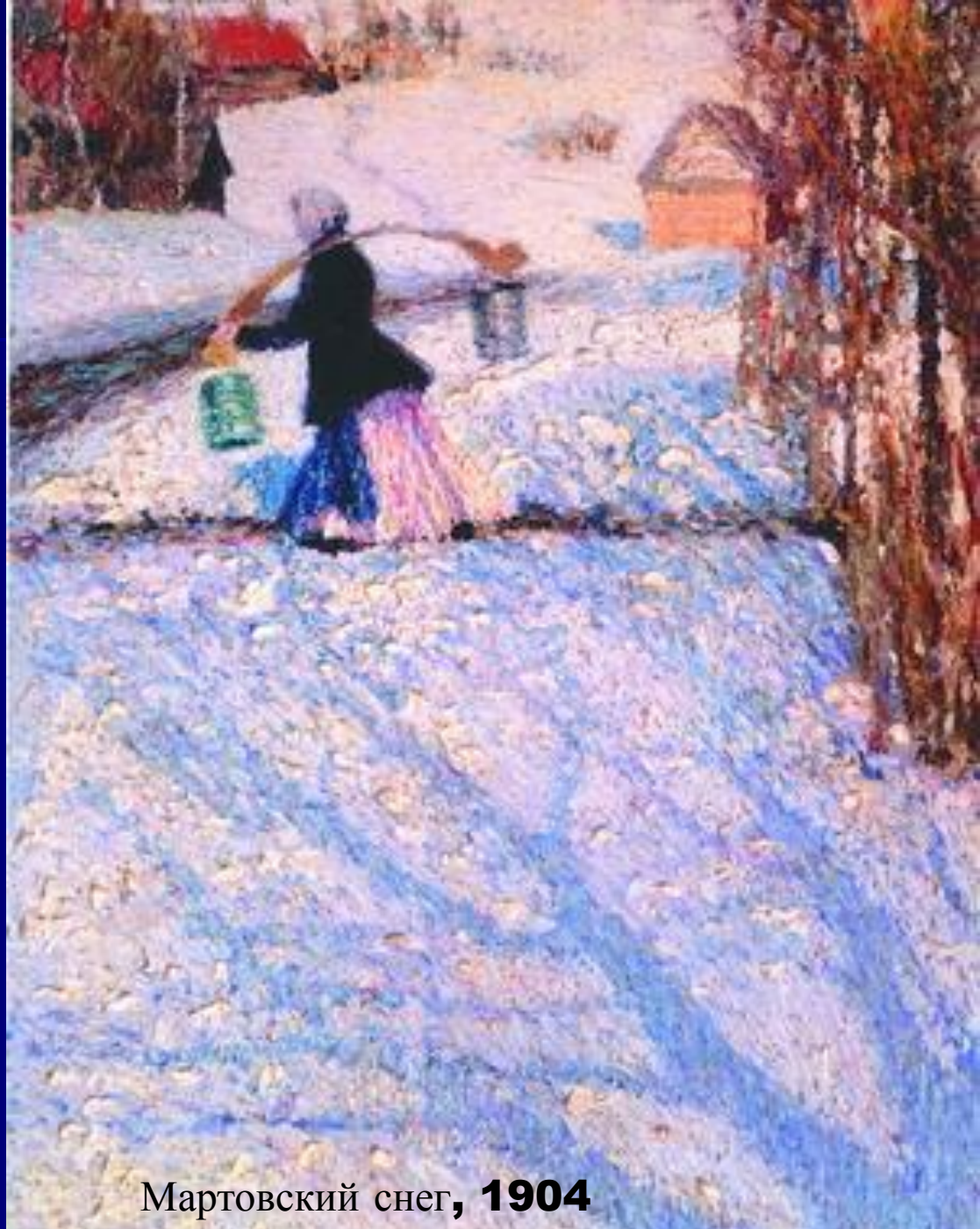
Мартовский снег, 1904