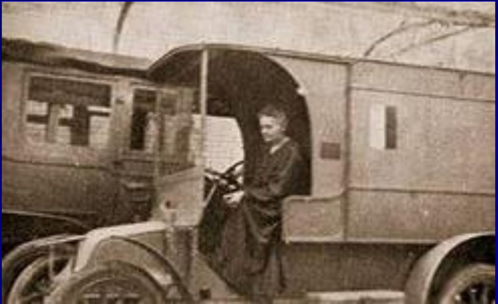
1914г. Мария Кюри в автомобиле с передвижной рентгеновской установкой