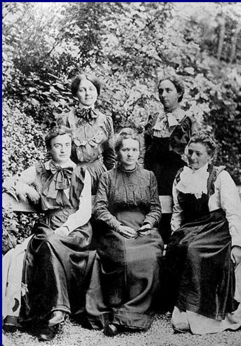
Мария Склодовская Кюри и сотрудницы