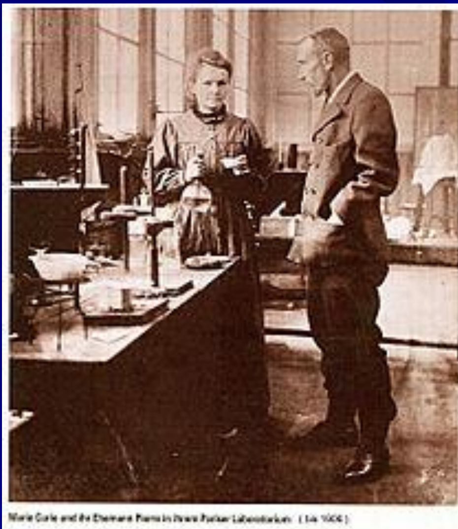
Marie Curie and her Chemist Pierre in Their Paris Laboratories (1904)