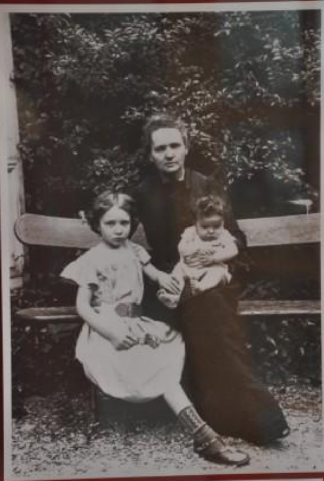
Maria Skłodowska-Curie z córkami - Ireną i Ewą. 1905r.

1904г. У супругов Кюри родилась вторая дочь Ева