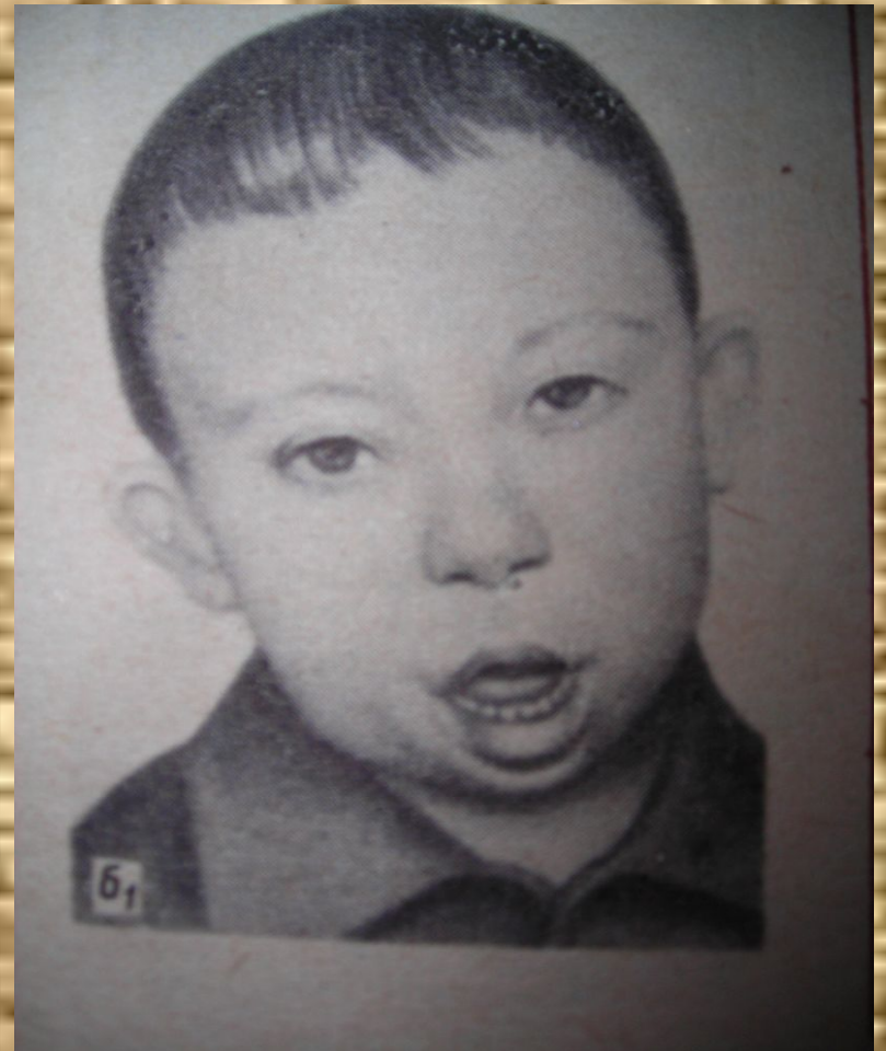
Дети, страдающие болезнью Дауна