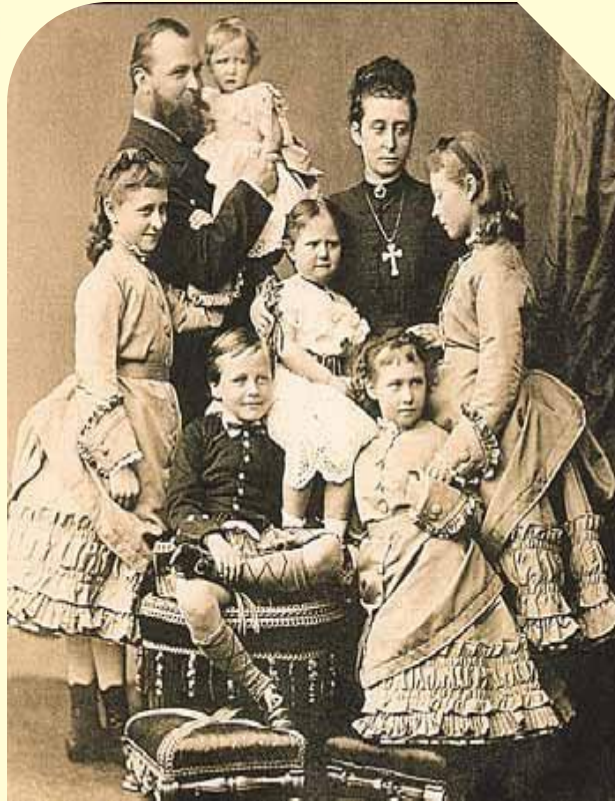
Семья Елизаветы Федоровны