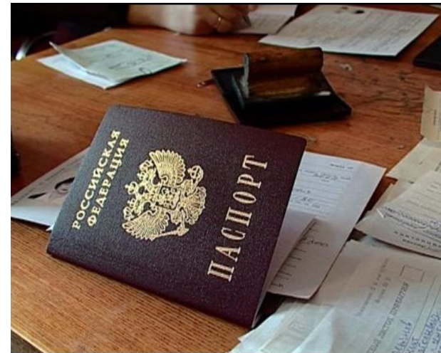
Право и правопорядок