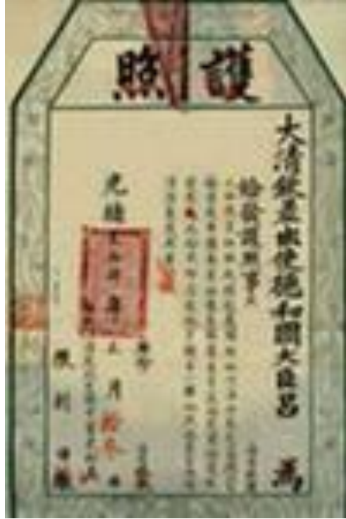
Китайский паспорт династии Цинь 1898 г