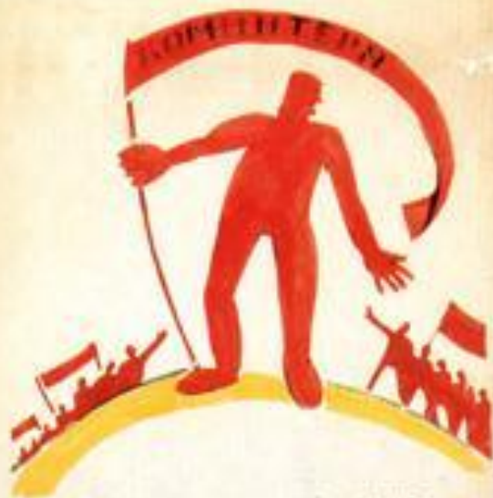
3. КОМИТЕТИМА НИЩО НЕ ПАСАТ КЪМНИТЕ ПЪЛЪК ВОСТАНИЕ СЪЩЕ