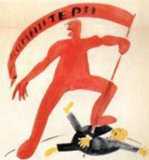
4. В ЕДИНИ НЕЧ. В ЕДИНИ ОНТ