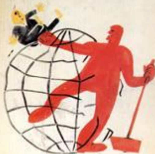
2. ЧИСТИТЕ ПОВЕТРИЦА