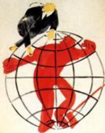
1. НИКТО НЕ МОЖЕТ НА ВЪЗДУХЕ