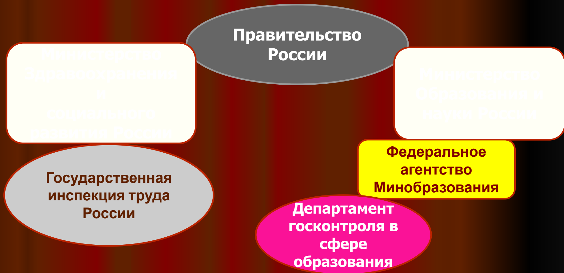
Схема государственного управления охраной труда