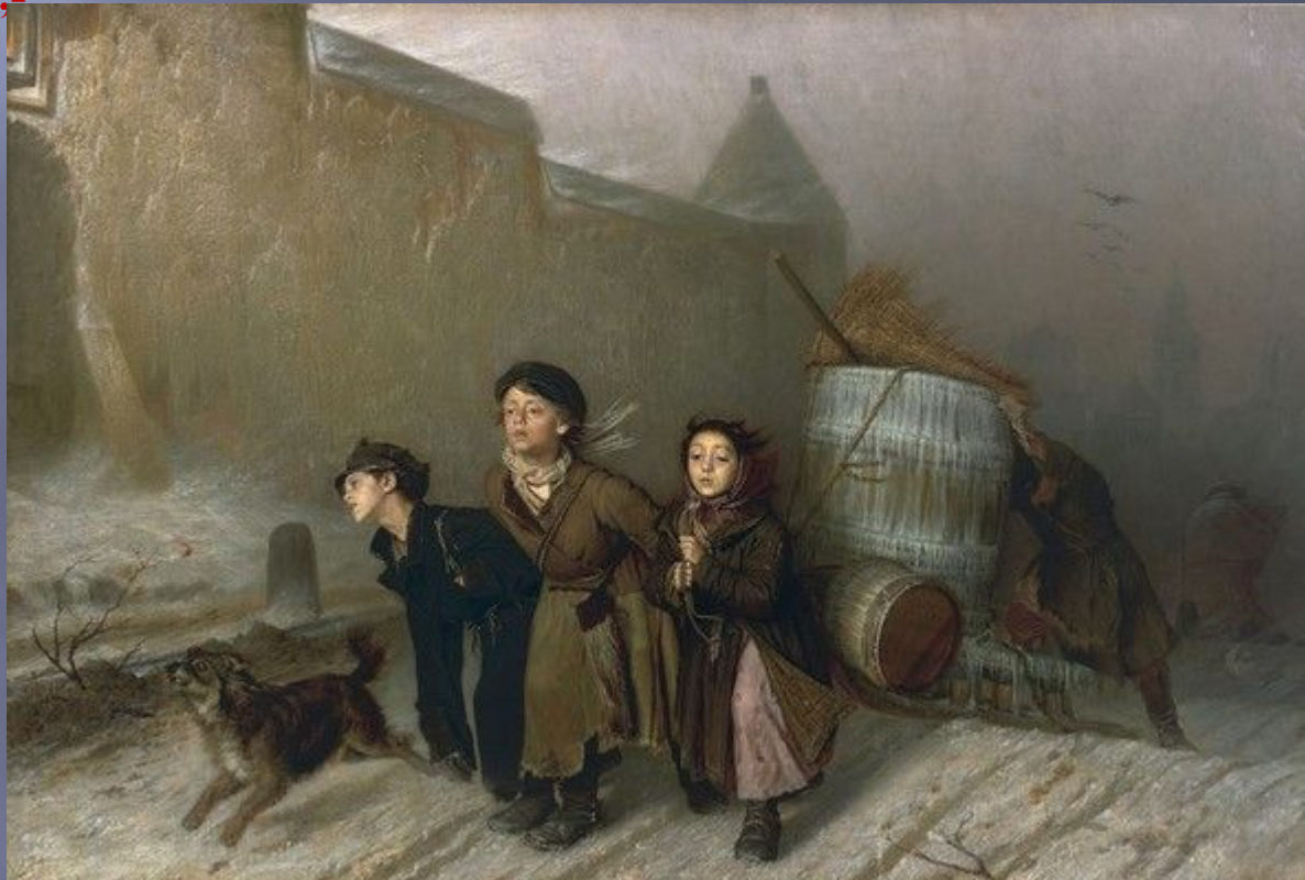
В.Г.Перов . Тройка.

..... Где уж нам, измученным в неволе, Ликовать, резвиться и скакать! Если б нас теперь пустили в поле Мы в траву попадали бы - спать. Нам домой скорей бы воротиться, Но зачем идем мы и туда?.. Сладко нам и дома не забыться: Встретит нас забота и нужда! Там, припав усталой головою К груди бледной матери своей, Зарыдав над ней и над собою, Разорвем на части сердце ей.