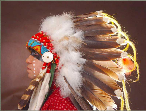
Головной убор вождя