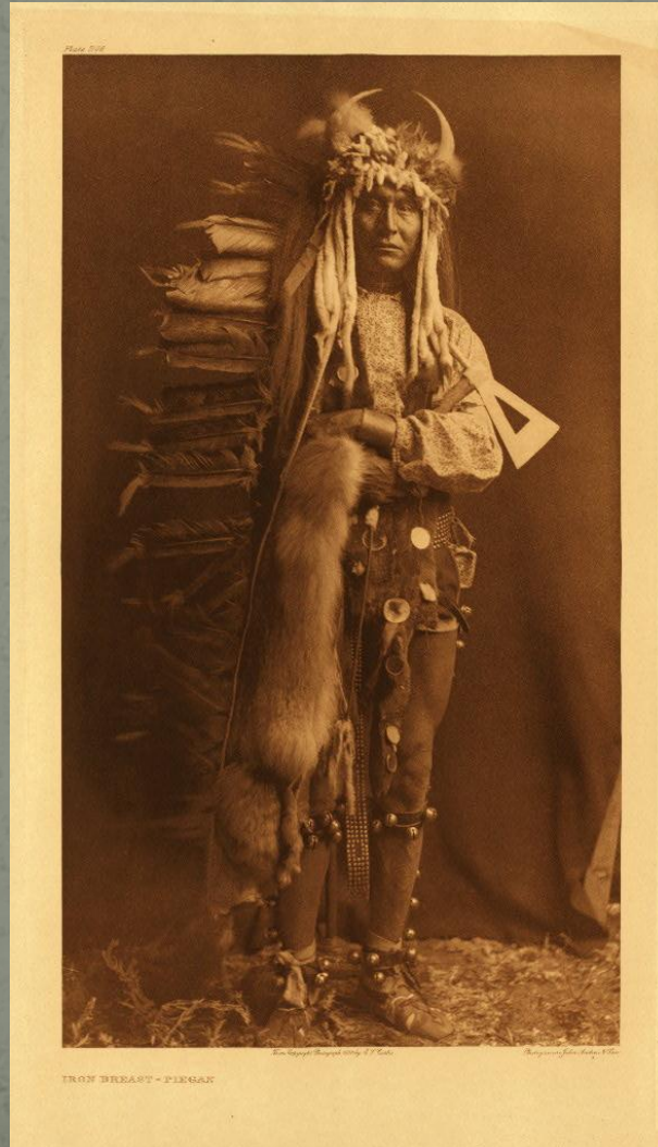
ГРОУ ЭНКАРТ - ГИЛЬЯК