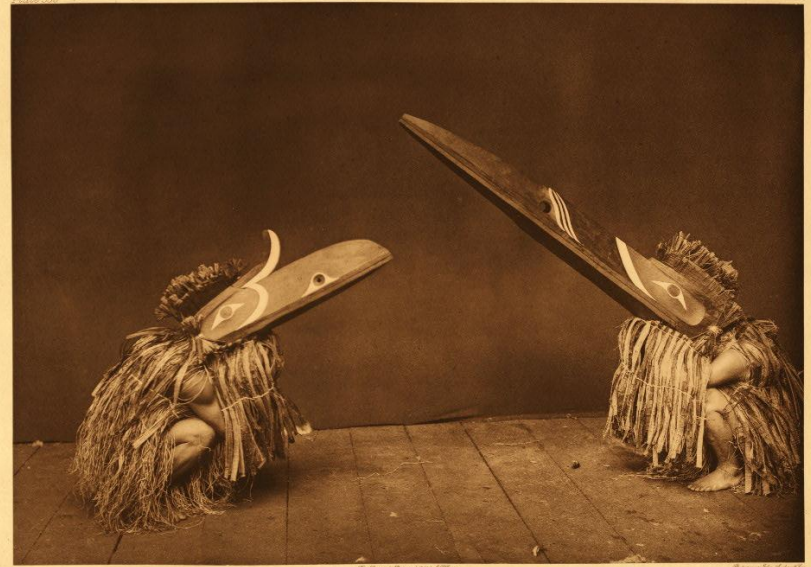
ИОБИУИ И НОБИУИ - НАКАМТОК