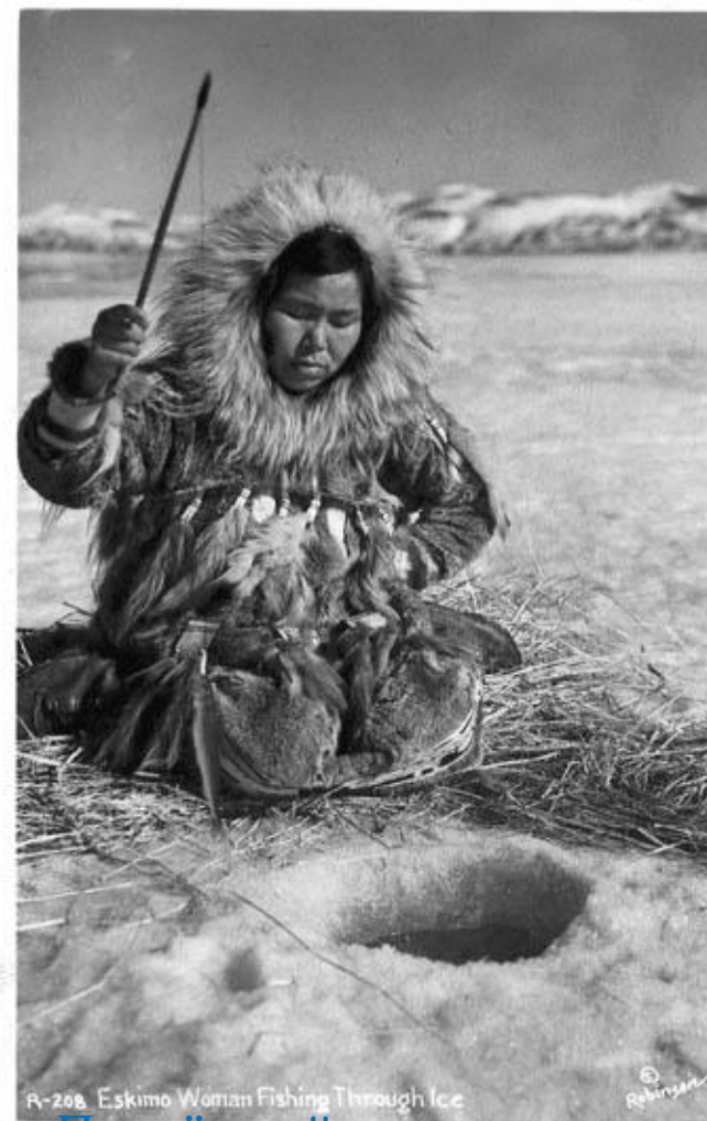
R-208 Eskimo Woman Fishing Through Ice