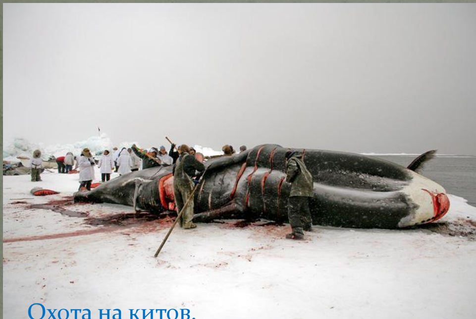
Охота на китов.

Поворотный гарпун- изобретение эскимосов