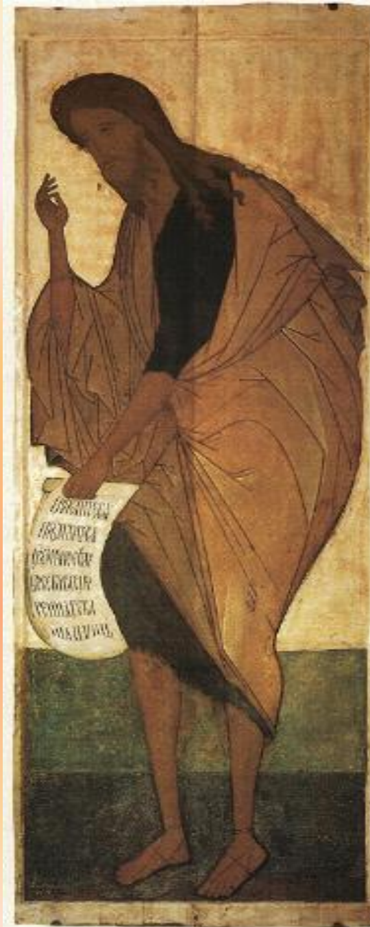
Рублев. Иоанн Предтеча.