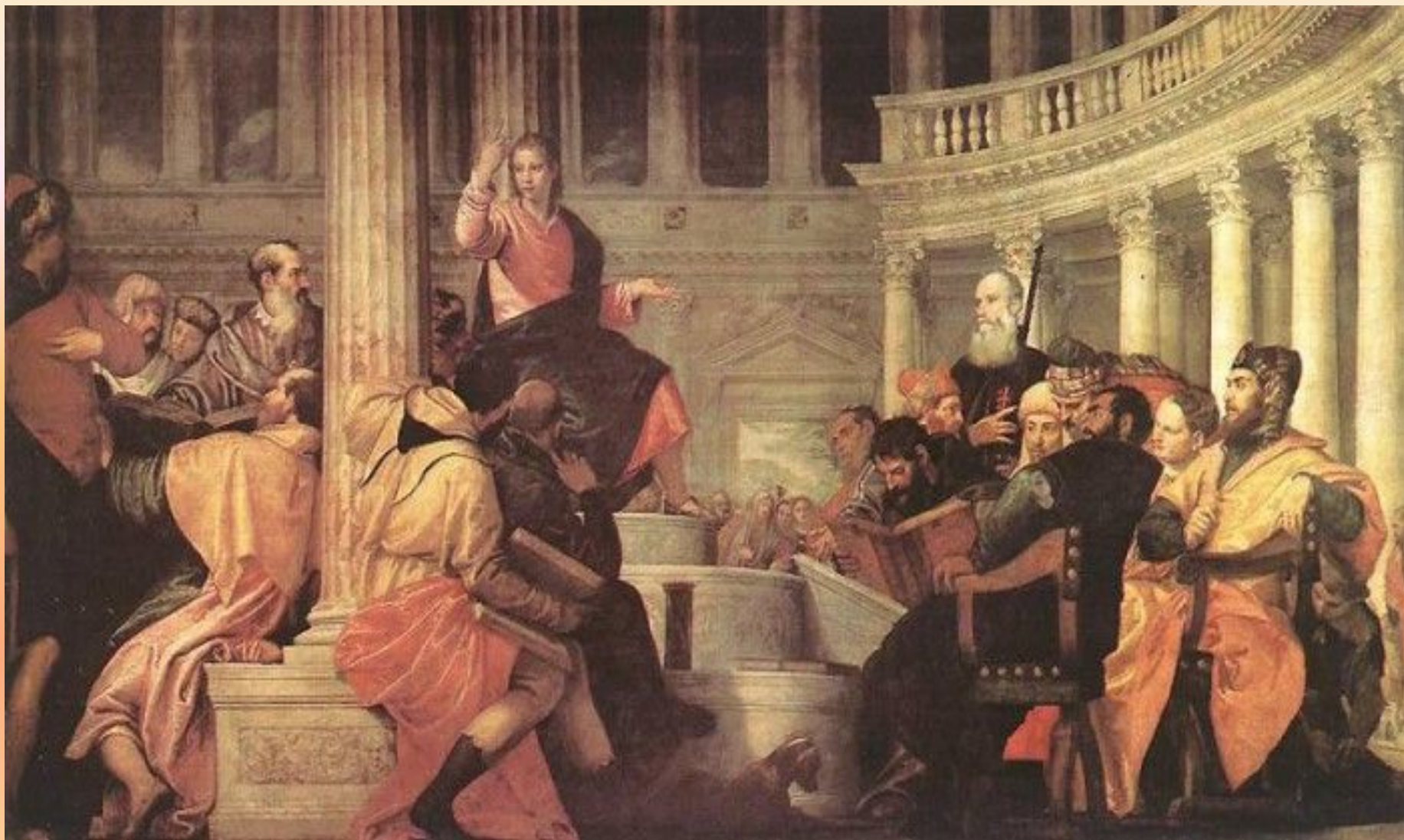
Веронезе. Христос среди учителей