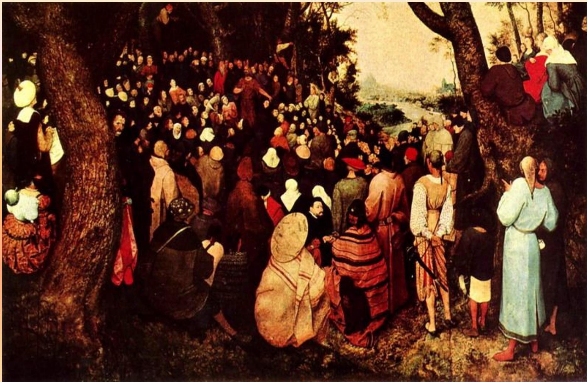
Брейгель. Проповедь Иоанна Крестителя.