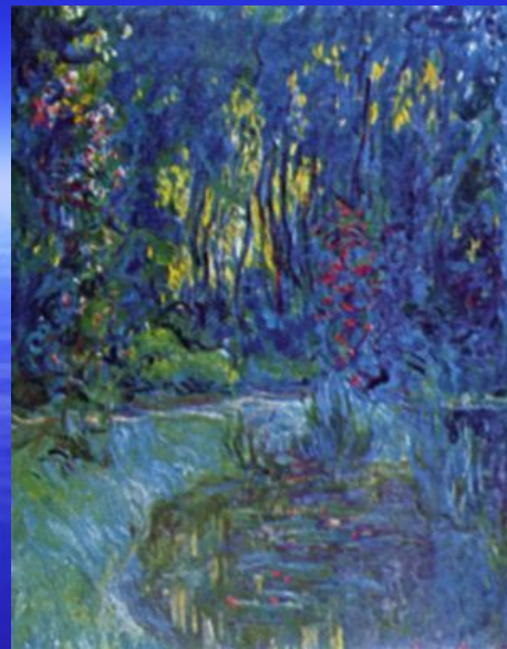
К. Моне. Сад с прудом в Живерне