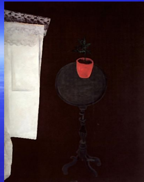
Штеренберг. Столик и елка.