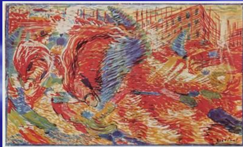
У. Боччони. Восставший город.