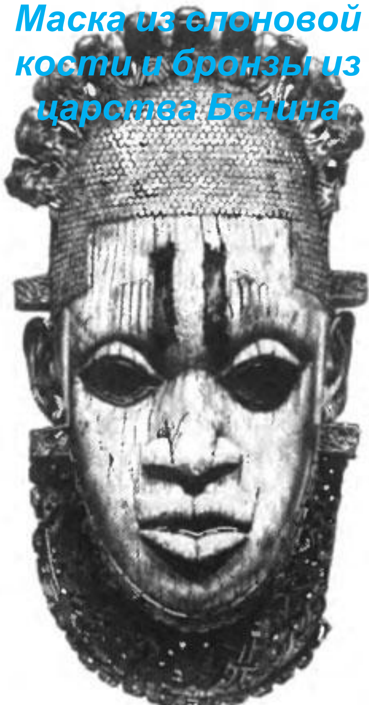
Маска из слоновой кости и бронзы из царства Бенина