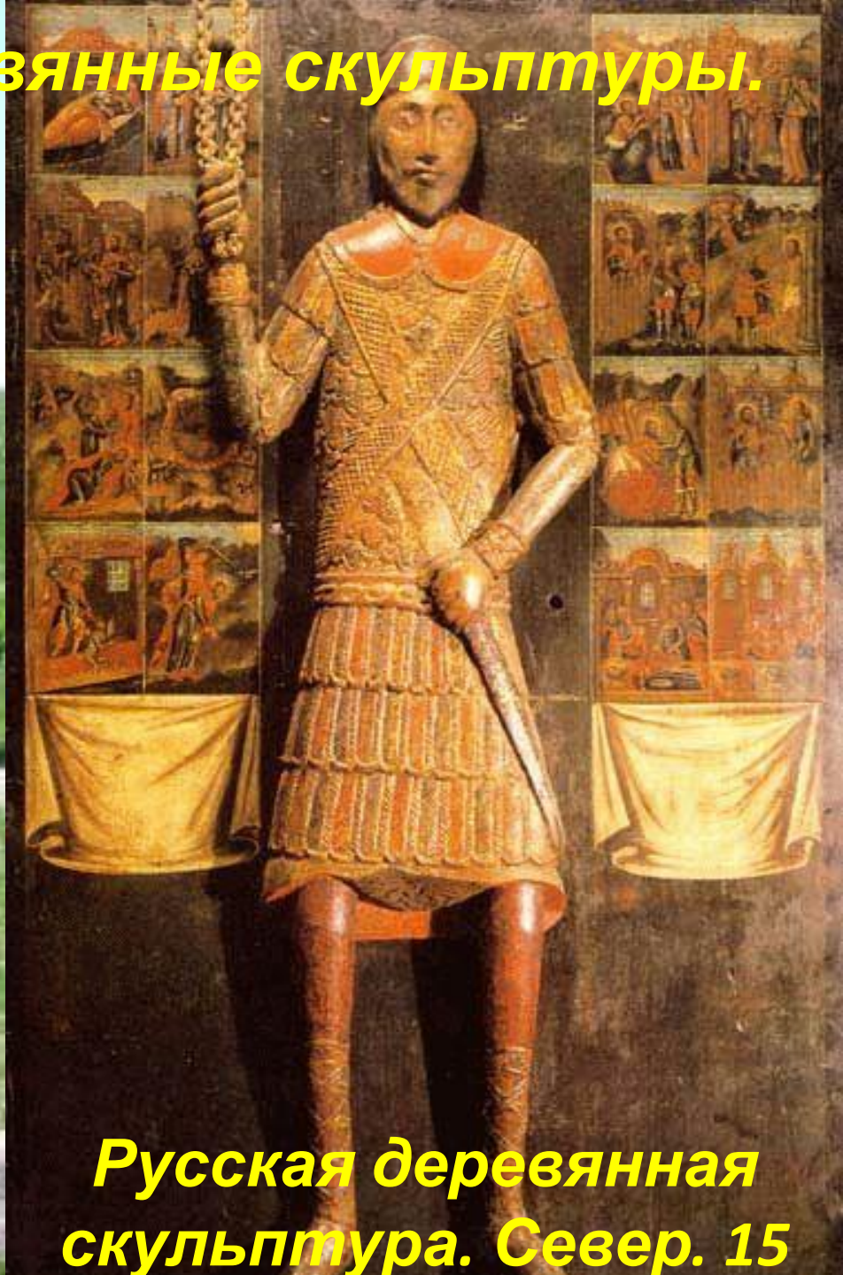
Русская деревянная скульптура. Север. 15