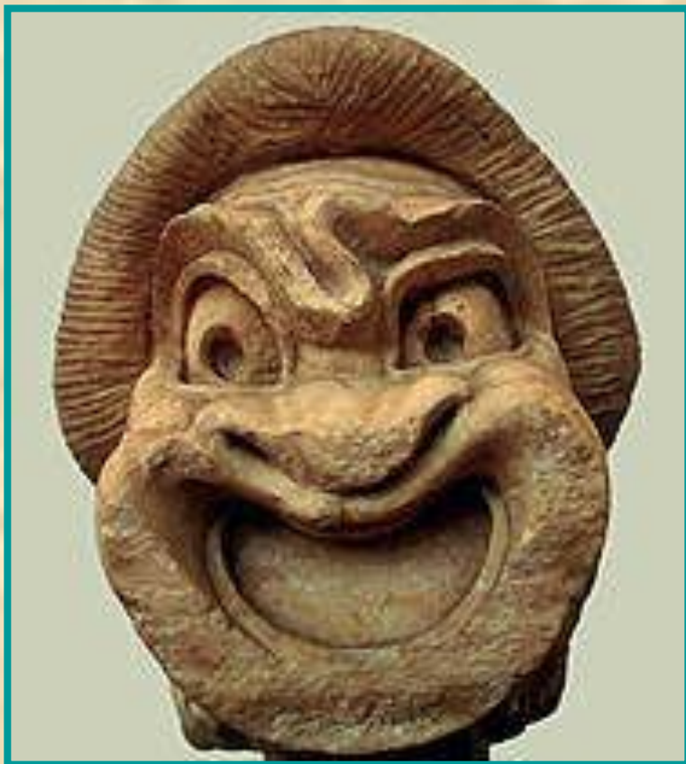
Древнегреческая театральная маска

Маски театральные употреблялись в античном театре, скоморохами, в итальянской комедии дель арте, традиционном театре Японии, Южной и Юго-Восточной Азии.