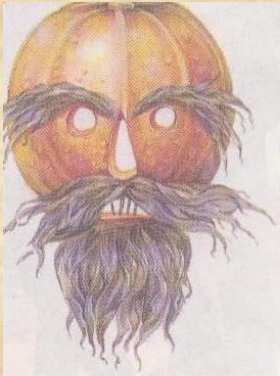
Адыгейская маска из тыквы