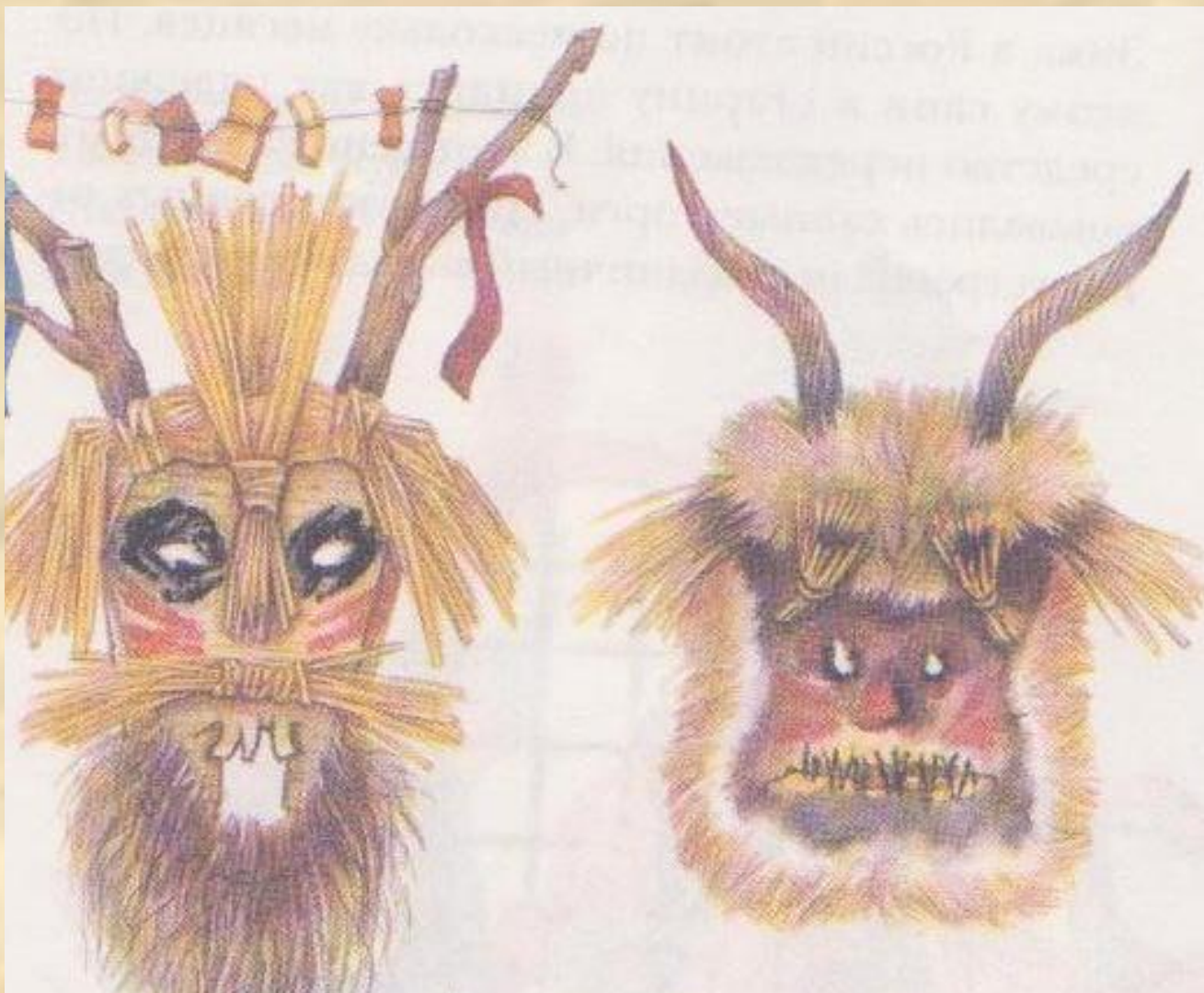
Русские святочные маски