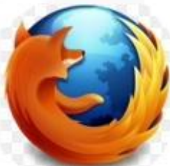
Логотип использовавшийся в Firefox 3.5 — 22.0 (2009— 2013)