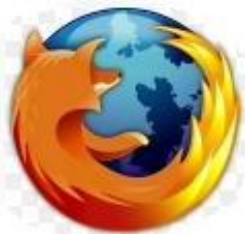
Логотип, использовавшийся в Firefox 1.0 — 3.0 (2004— 2009)