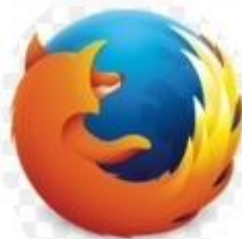
Текущий логотип, начиная с Firefox 23 (с 2013)