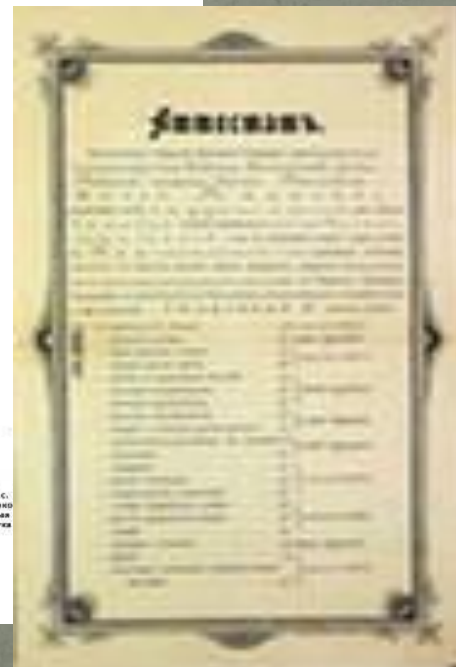
Рис. роко ска Буя