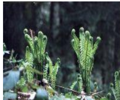
Папоротник Щитовник мужской