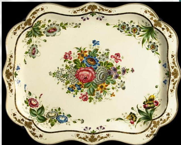
роспись с углов