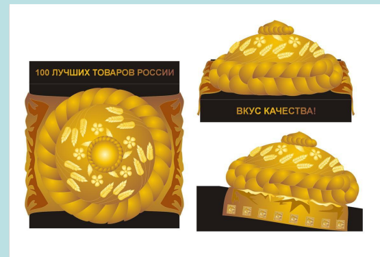
Приз «Вкус качества»

Почетный знак «ЗА ДОСТИЖЕНИЯ В ОБЛАСТИ КАЧЕСТВА»