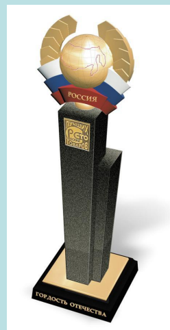
Приз «Гордость Отечества»