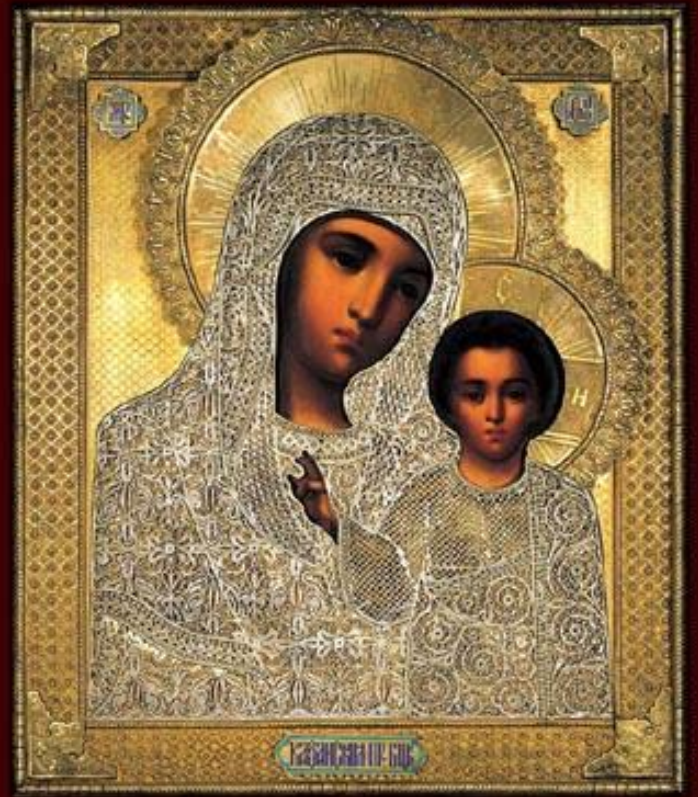
Казанская икона Богородицы в окладе (XIX век)

На месте явления иконы был построен Богородицкий девичий