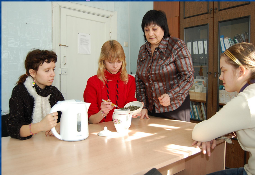
Приготовление общеукрепляющего чая

На уроках домоводства, изучая тему «Целебное питание», учащиеся знакомятся с понятием «фитотерапия», учатся с помощью литературы находить рецепты применения фиточая, а на практических занятиях готовят простые всем доступные полезные чаи.