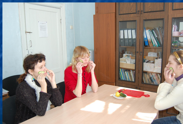
Из свежих огурцов делают маски, они осветляют загар, отбеливают кожу, делают ее эластичной.