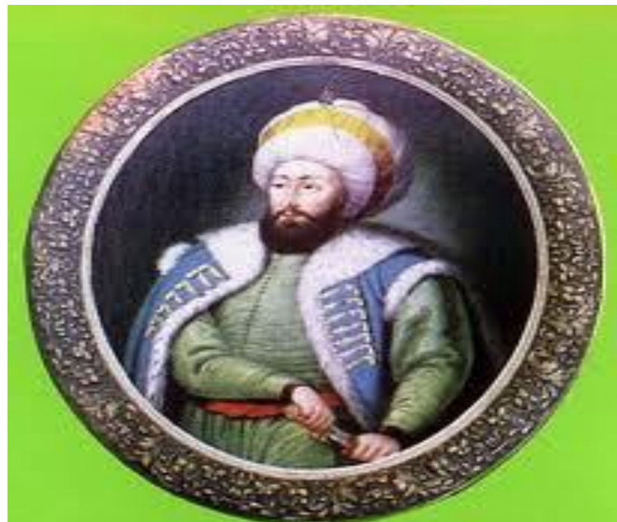
7. Sultan Mehmed II. (Fatih) 1444-1446 / 1451-1481