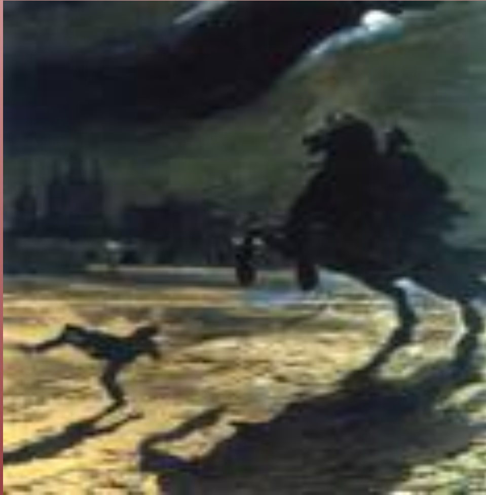
А.С Пушкин «Медный всадник».