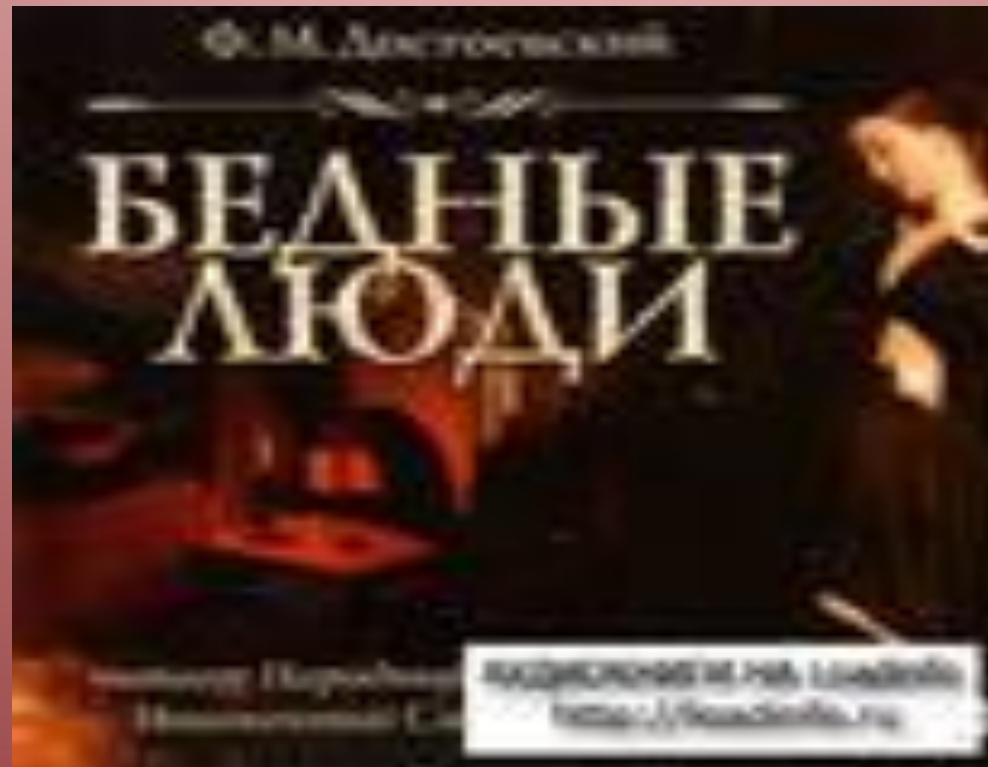
Ф.М. Достоевский «Бедные люди». Титульный лист романа.