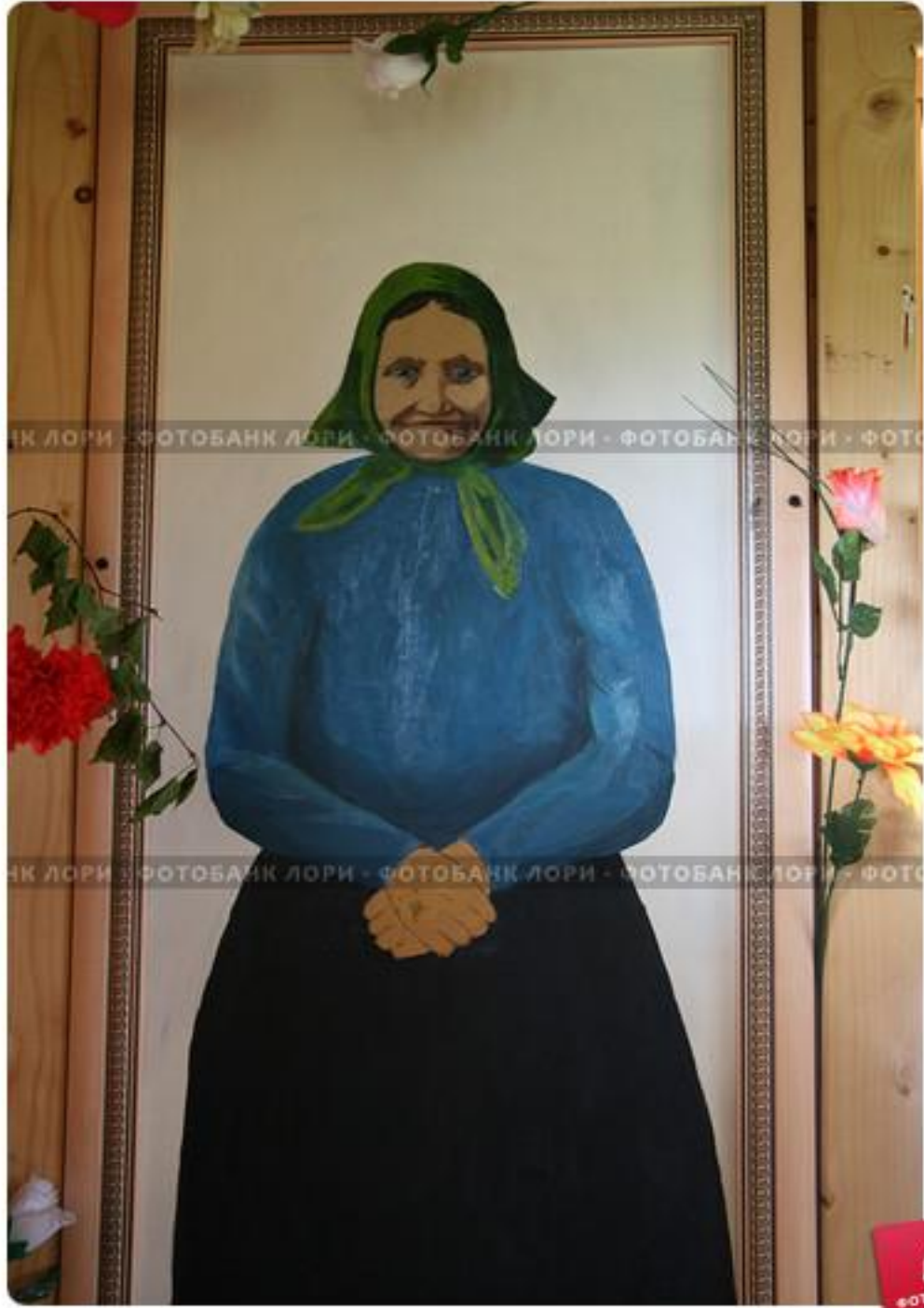
Карелия. Заонежье. Часовня Святого ВМЧ Георгия Победоносца. Портрет И.А.