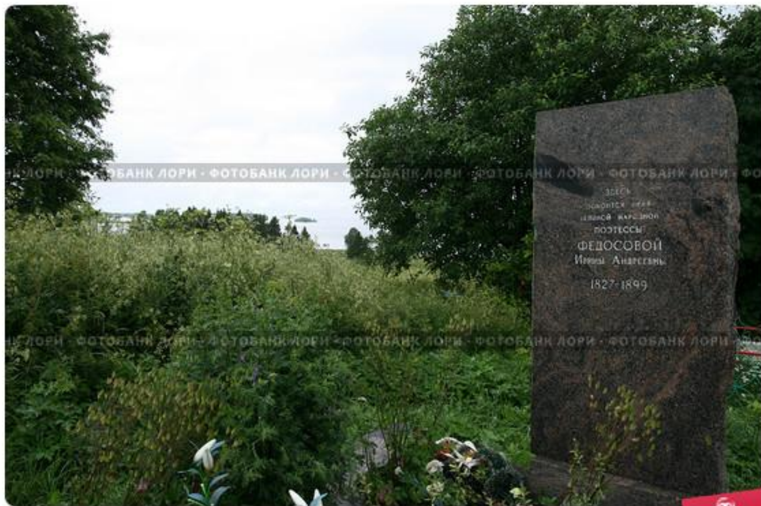
Карелия. Заонежье. Памятник на могиле И.А. Федосовой, народной поэтессы-сказачки