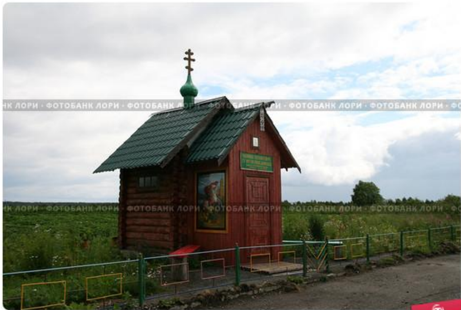
Карелия. Заонежье. Часовня Святого ВМЧ Георгия Победоносца (установлена в 2011 году)