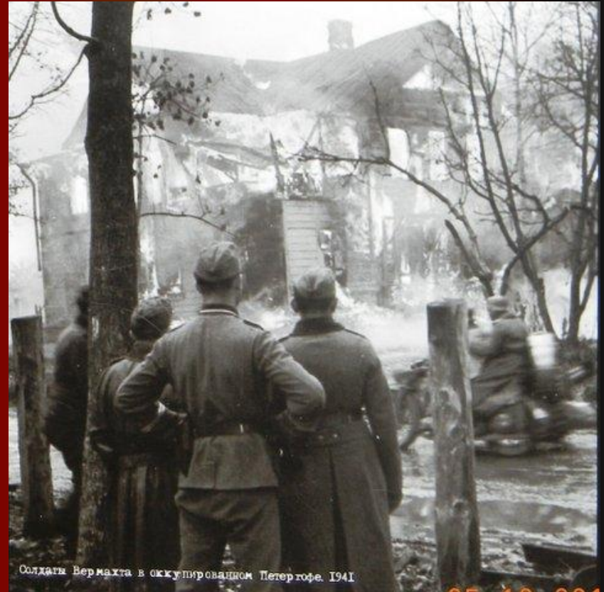
Солдаты Вермахта в оккупированном Петергофе. 1941