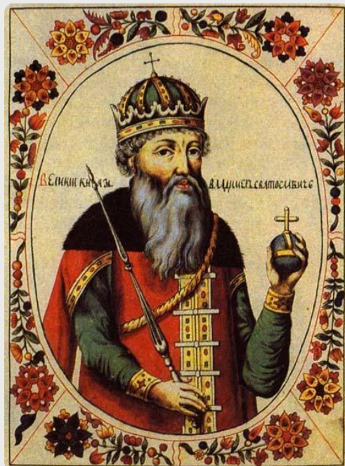
Владимир Красное Солнышко