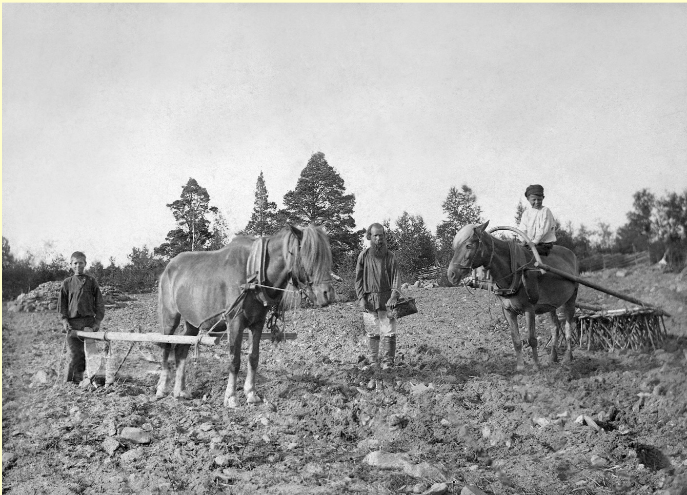
Пахота и сев в Олонецкой губернии. Фото начала XX века