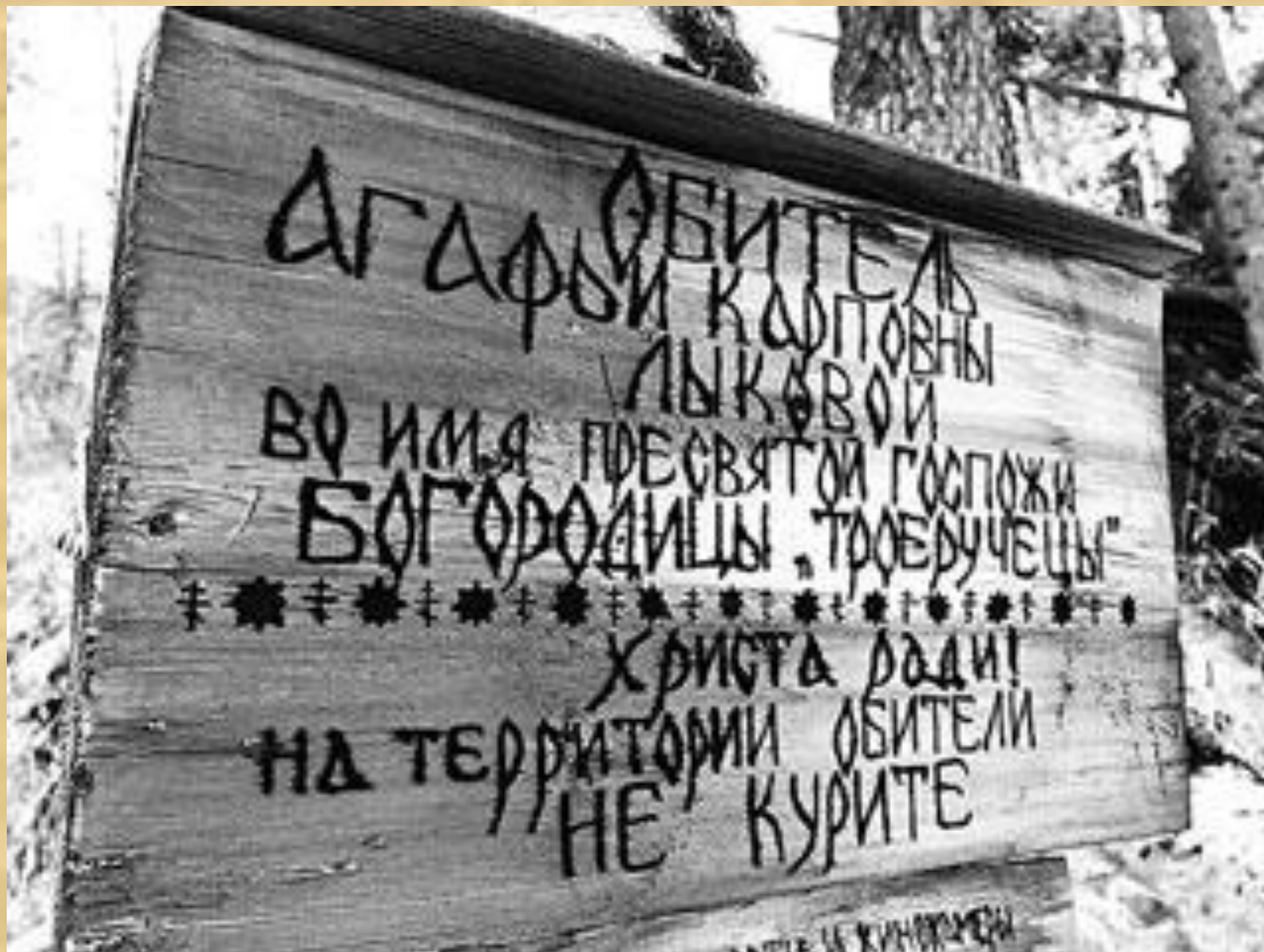
Агафья Лыкова-хозяйка обители на Еринате