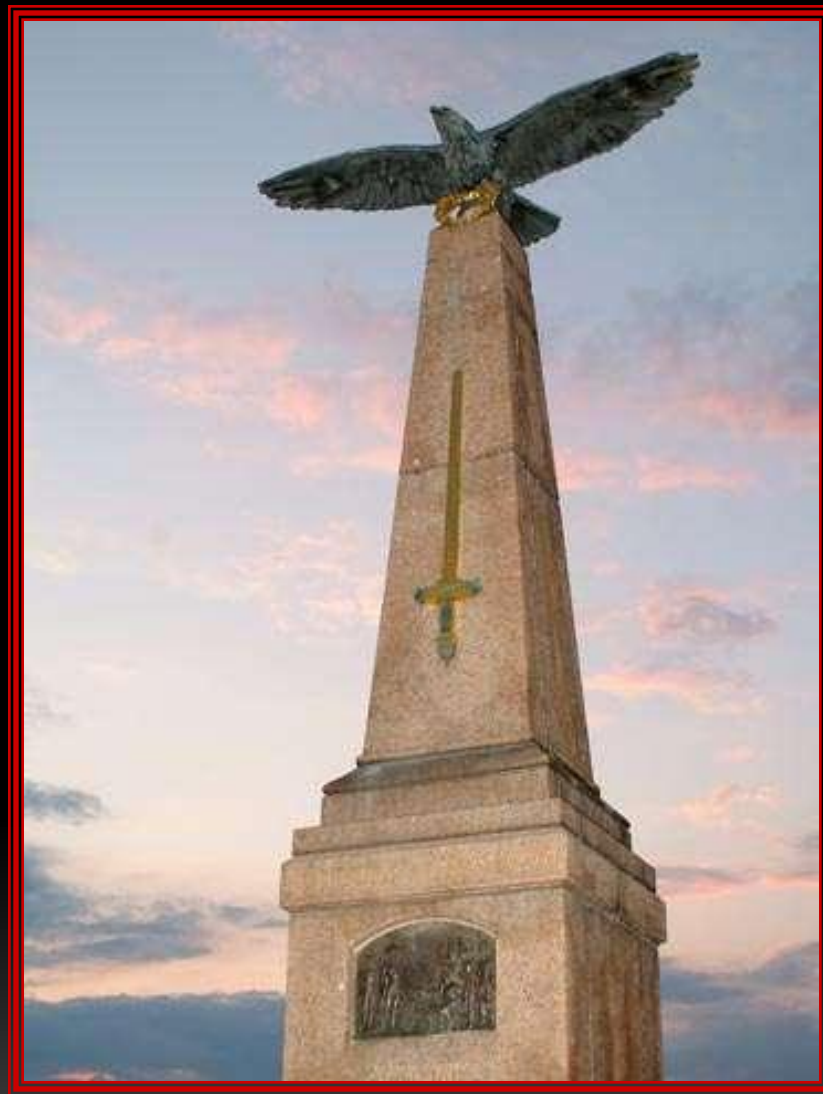
Памятник на командном пункте Кутузова