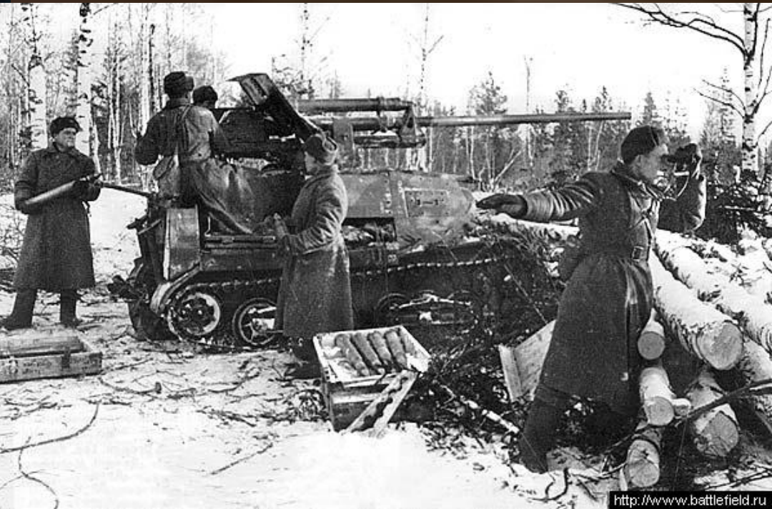
Оборону Москвы возглавил генерал Георгий Константинович Жуков.