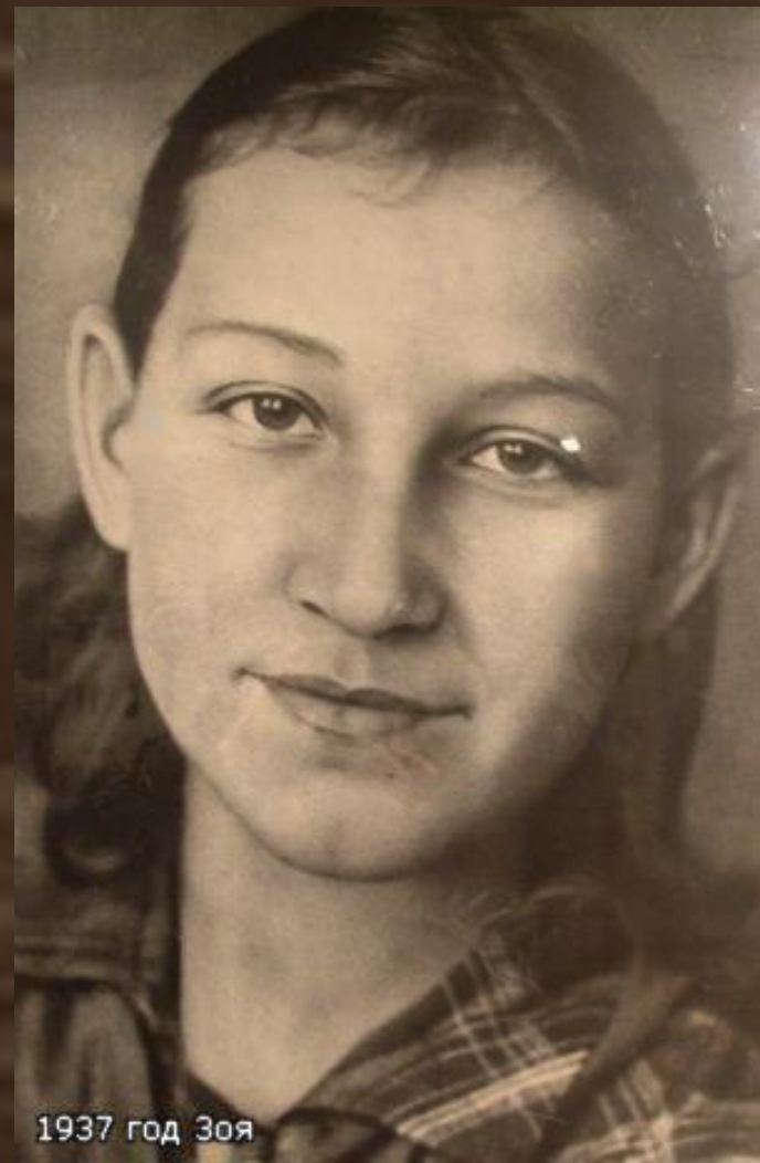
1937 год Зоя

Перед уходом на фронт, прощаясь с матерью, она сказала: «Не плачь, родная. Вернусь или умру героем...»