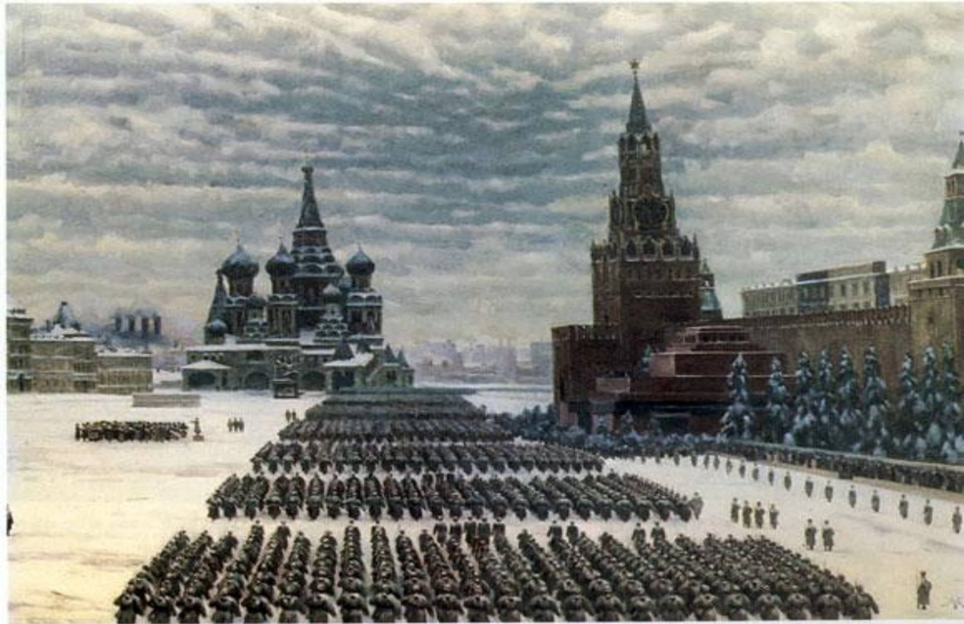
7 ноября 1941 г. на Красной площади состоялся военный парад. Его участники прямо с парада уходили фронт.