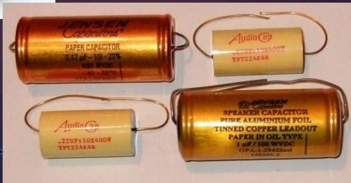
Бумажный и пленочный конденсатор