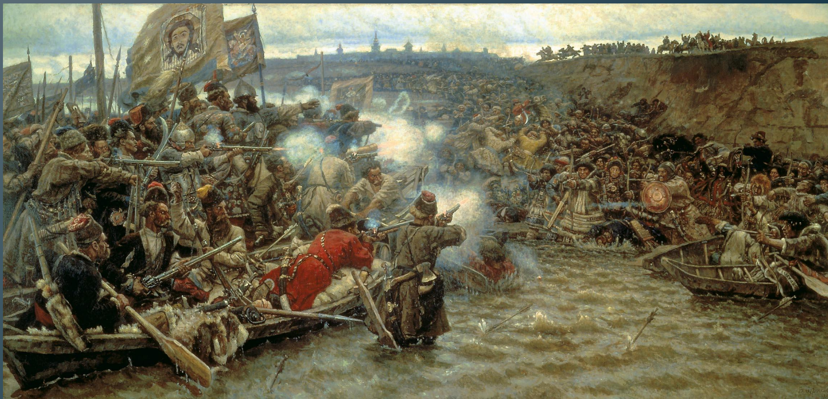
«Покорение Сибири Ермаком», Суриков.