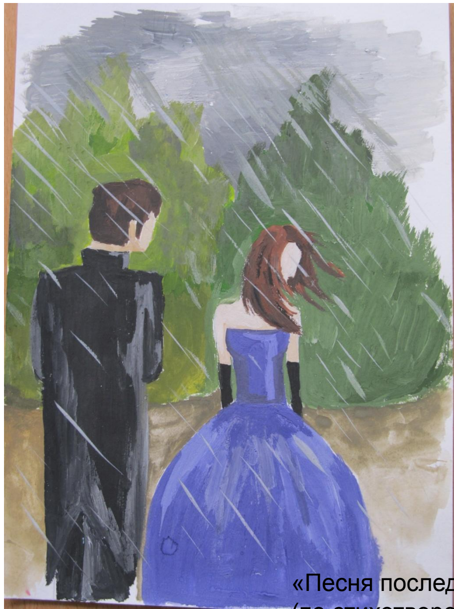
«Песня последней встречи» (по стихотворению А. Ахматовой) Автор: Астахова Елена