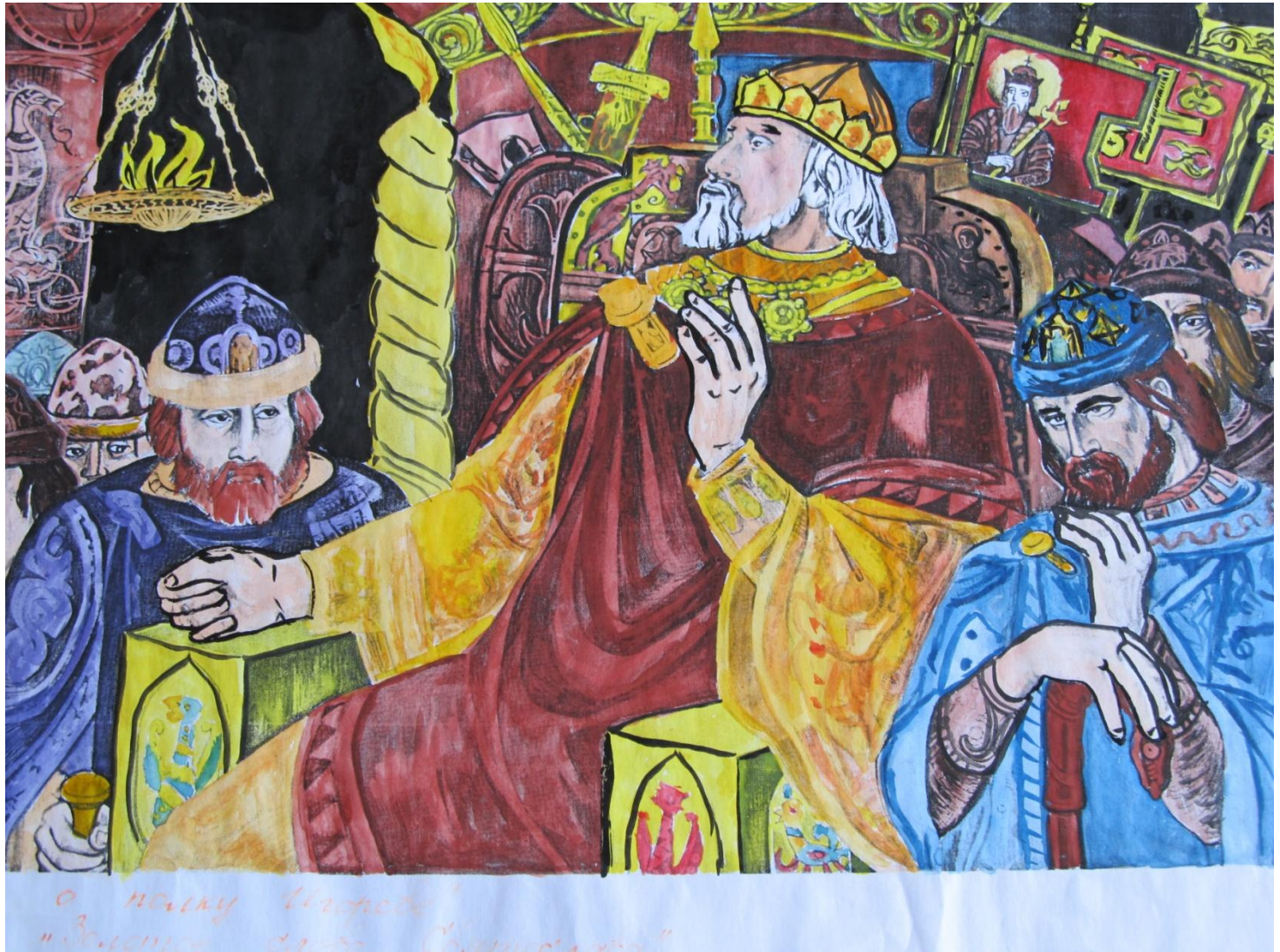
«Золотое слово Святослава» Автор: Приходченко Влад