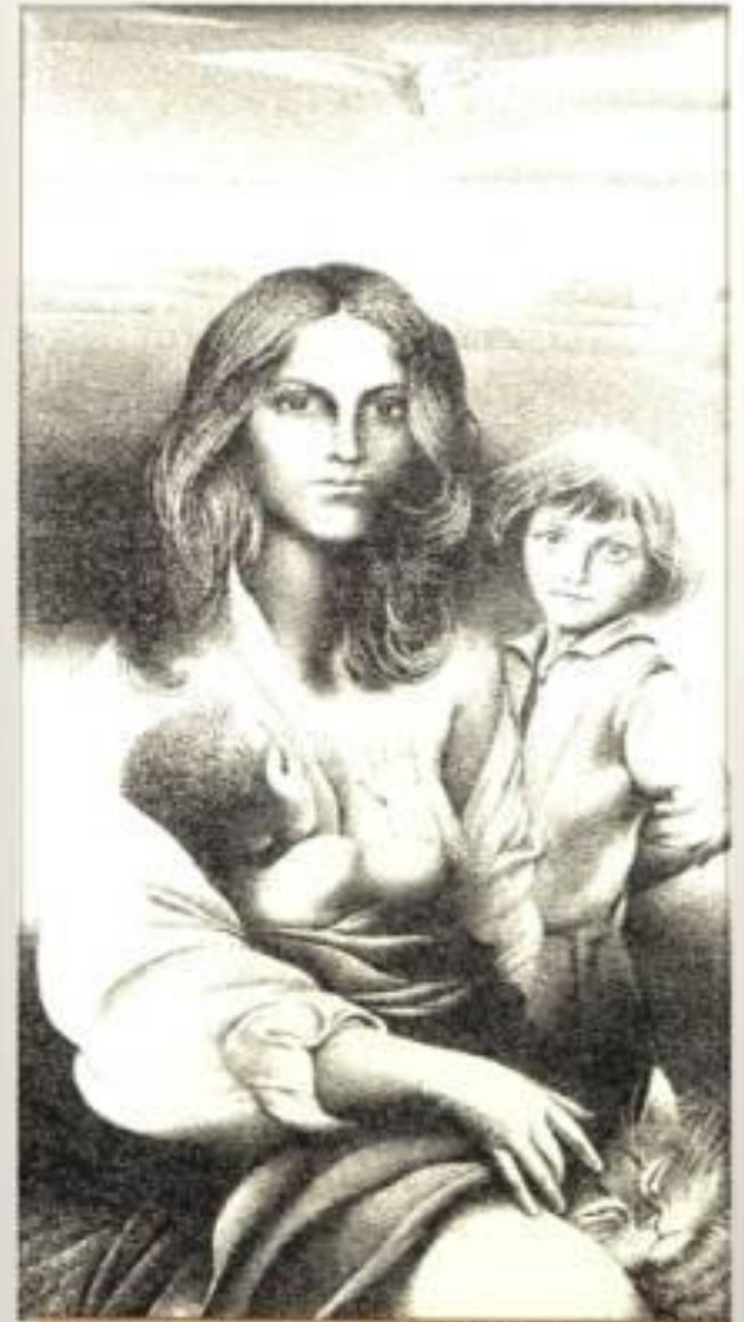
Репродукция картины Рафаэля «Младенца Христа кормит Матерь Мария» (1505 г.)