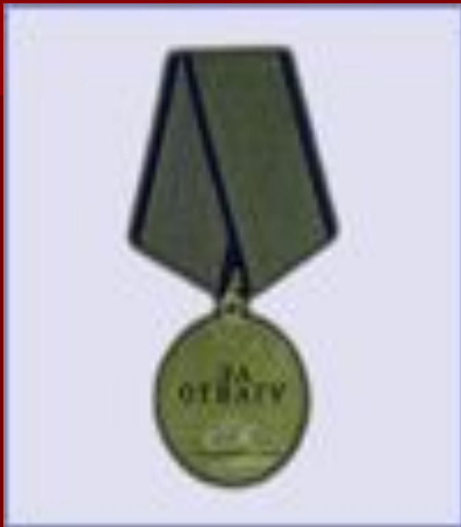
медаль "За Отвагу"