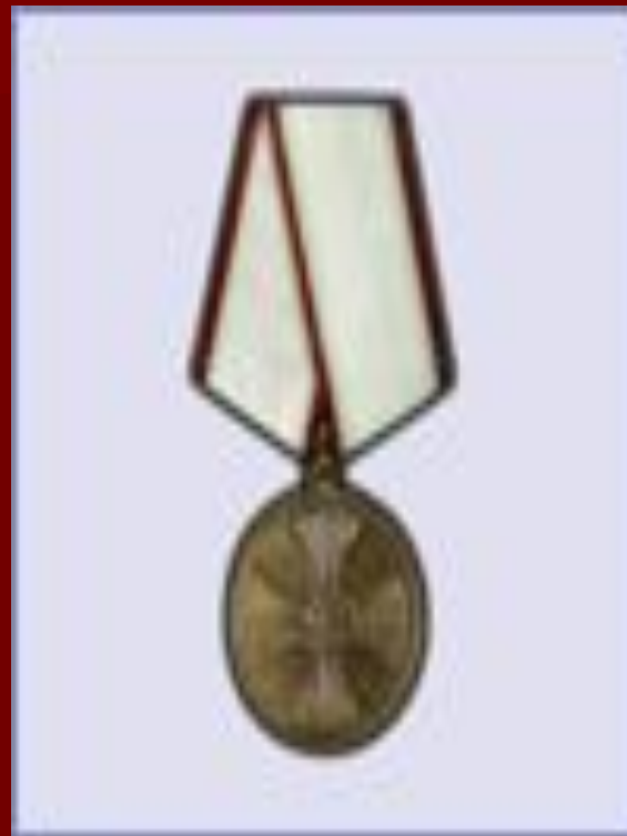
медаль "За спасение погибших"