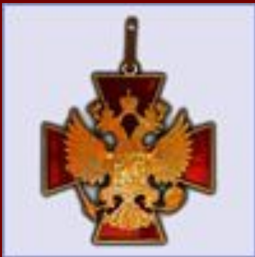
орден "За заслуги перед Отечеством"

Пожарное дело- для крепких парней, Пожарное дело- спасение людей, Пожарное дело-отвага и честь, Пожарное дело- так было и есть!