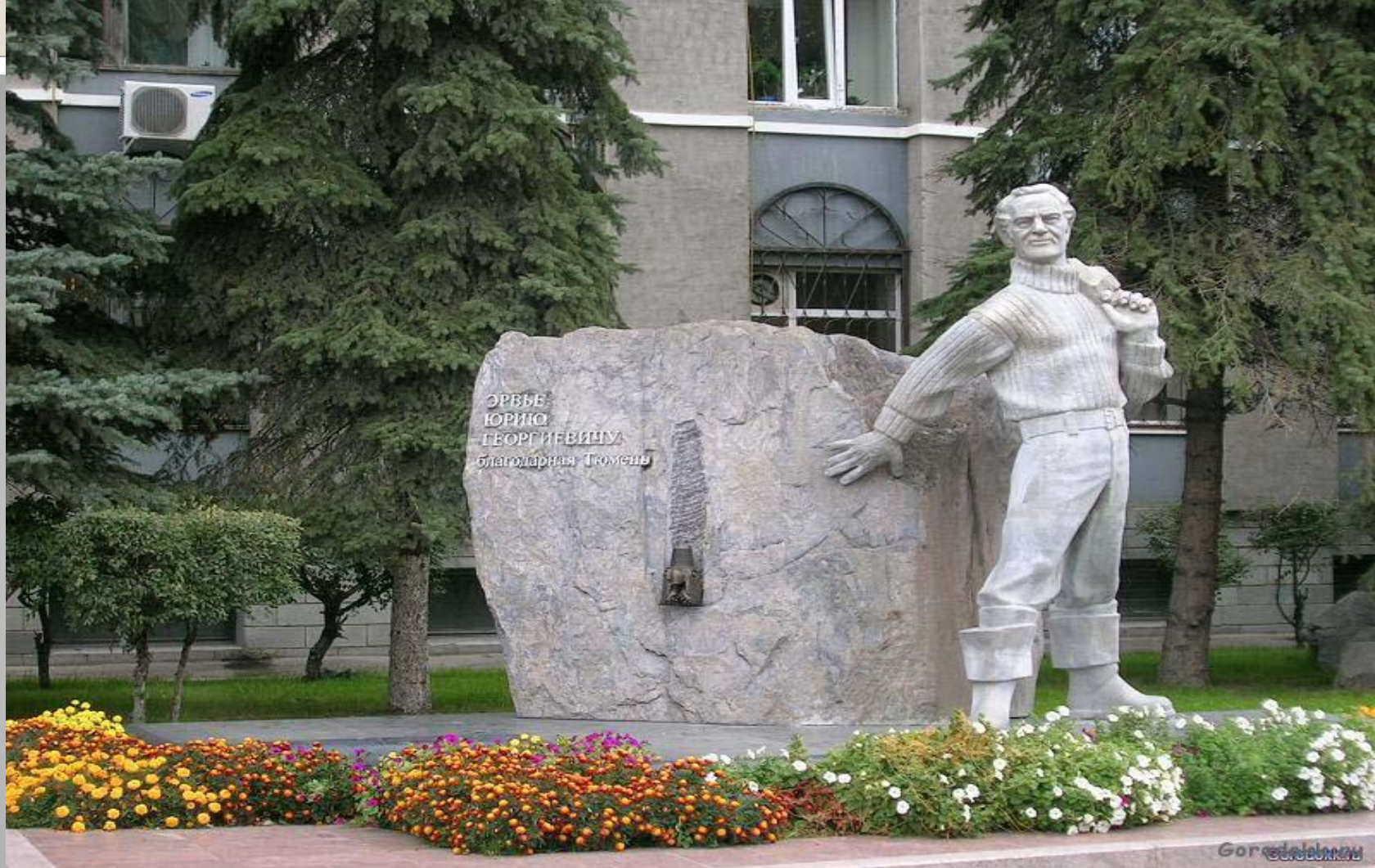
Памятник Эрвье Юрию Георгиевичу - одному из первооткрывателей тюменской нефти