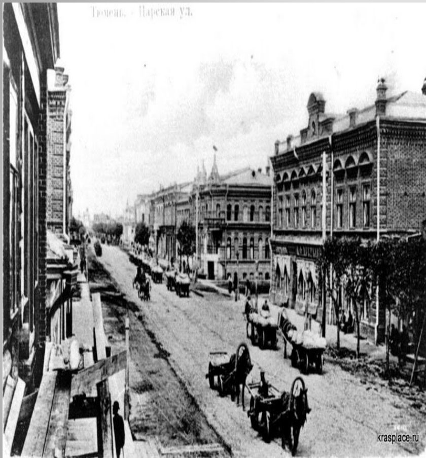
ул. Царская (до 1919 года)