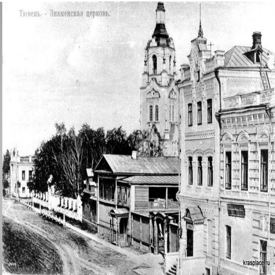
Тюмень. - Знаменская церковь.