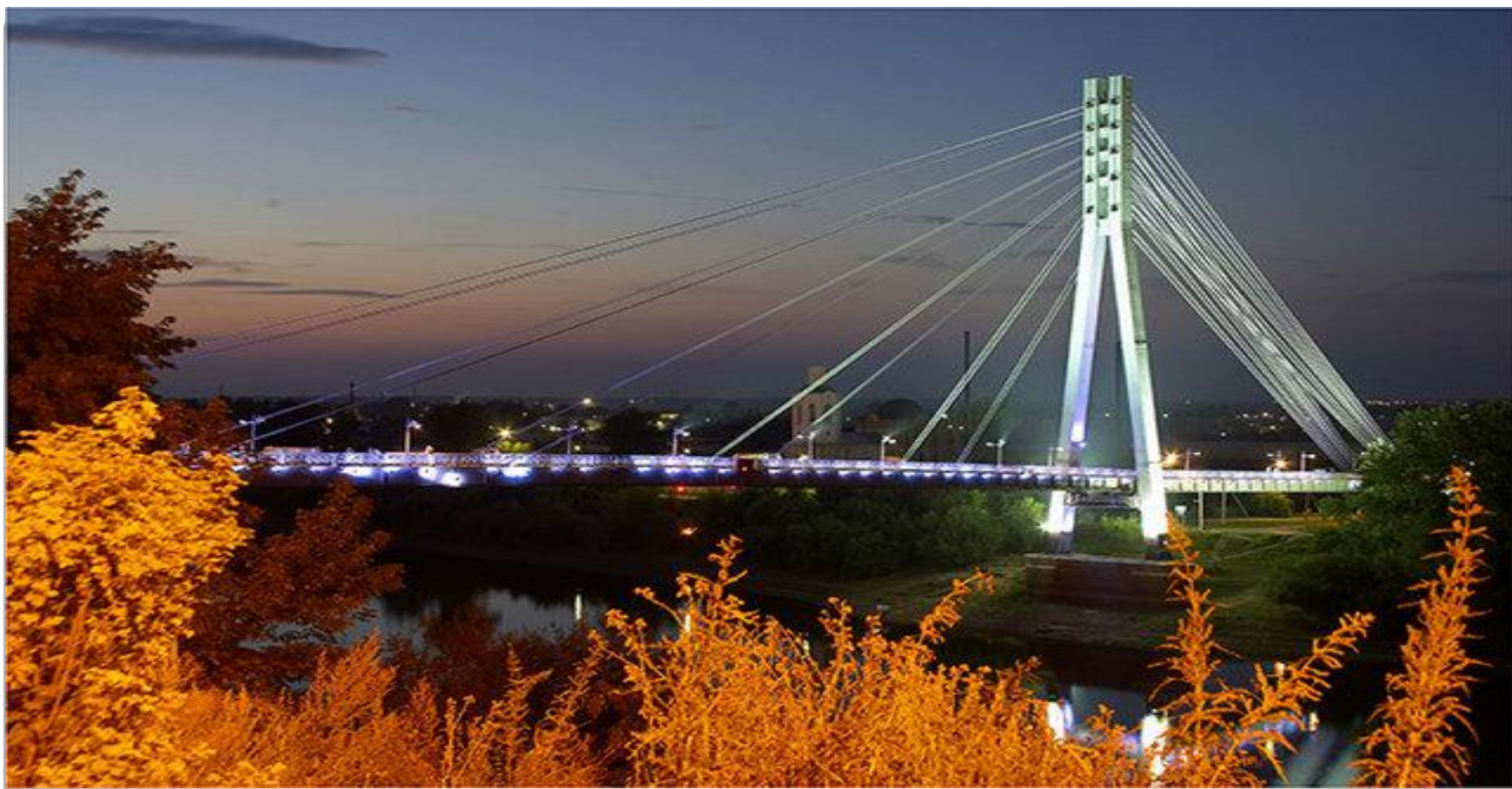
Пешеходный мост в Тюмени