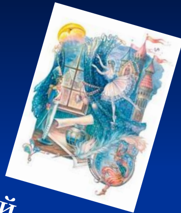
«Стойкий оловянный солдатик»