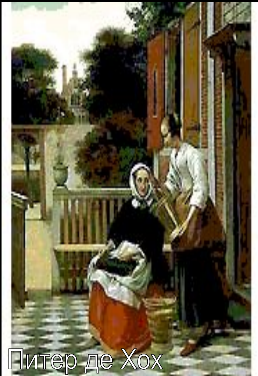
Питер де Хох