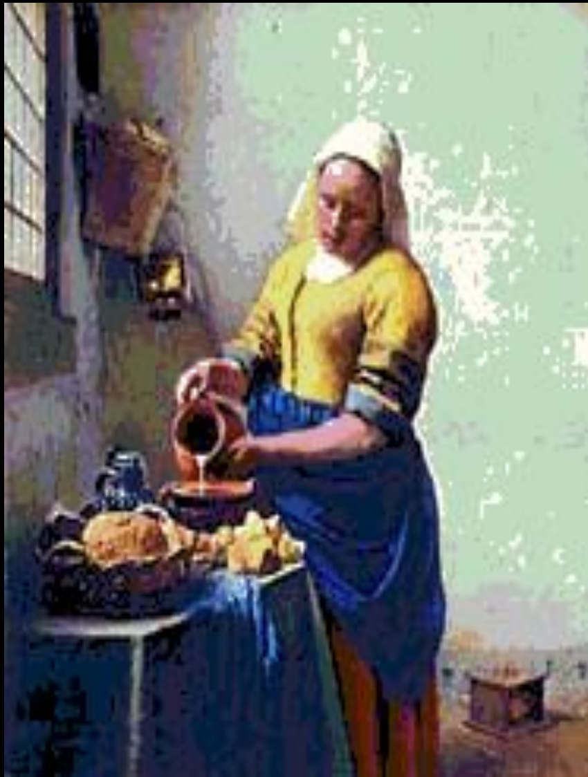
Служанка с кувшином