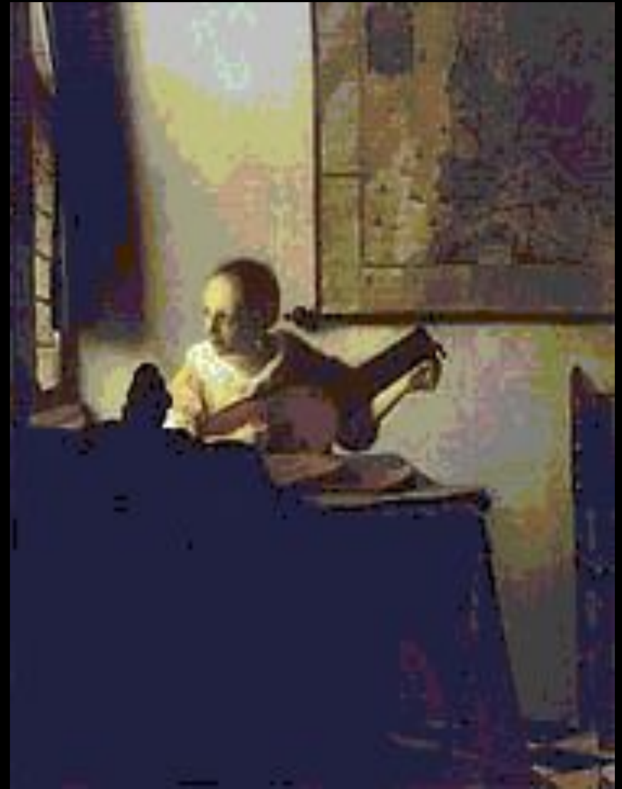
Дама с лютней