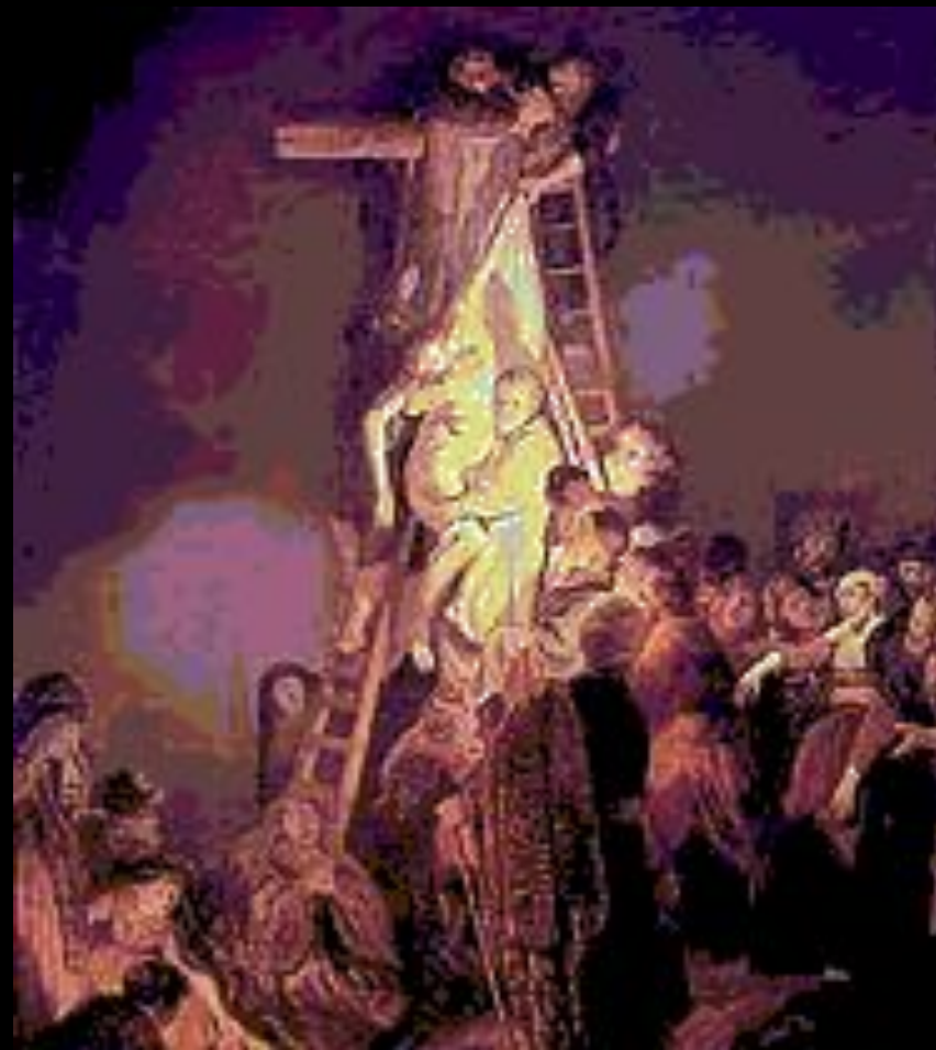
Снятие с креста