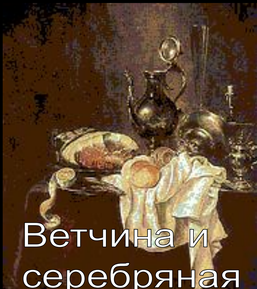
Ветчина и серебряная посуда