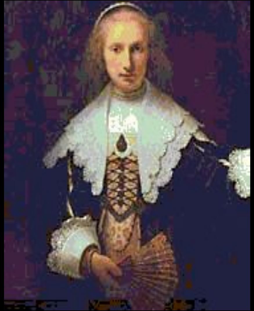
Портрет Агаты Бас