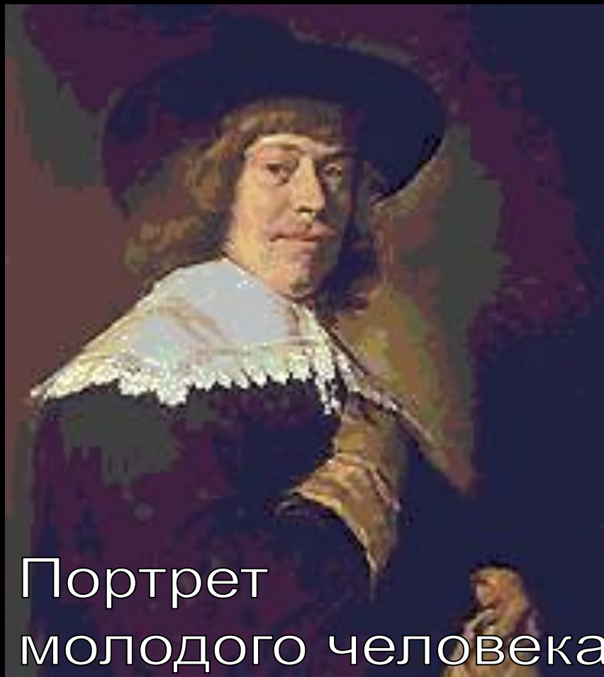
Портрет молодого человека с перчаткой