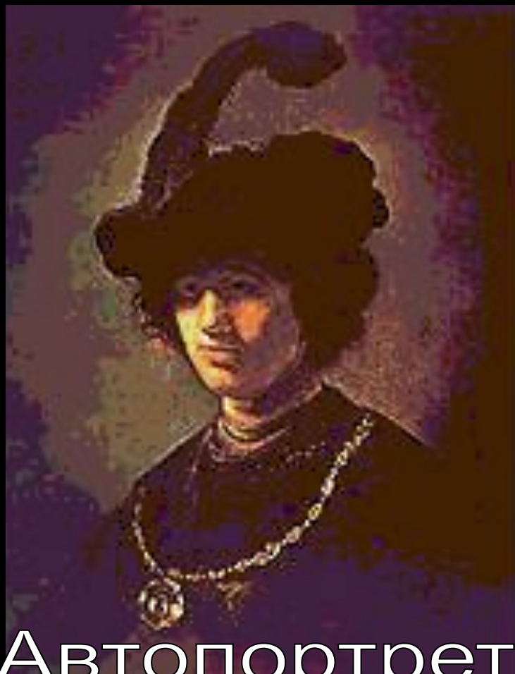
Автопортрет в молодости