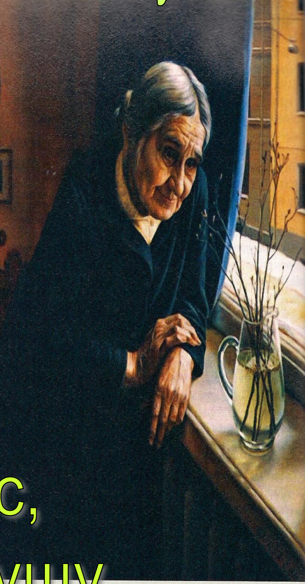
Шинин В. Зацвел багульник. 1980

Сама жизнь заглядывает в нас, обнажает нашу душу