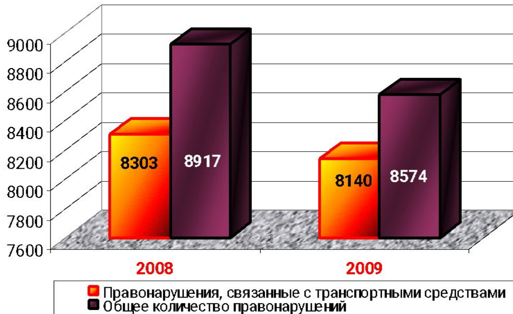
ДТП и общее число правонарушений