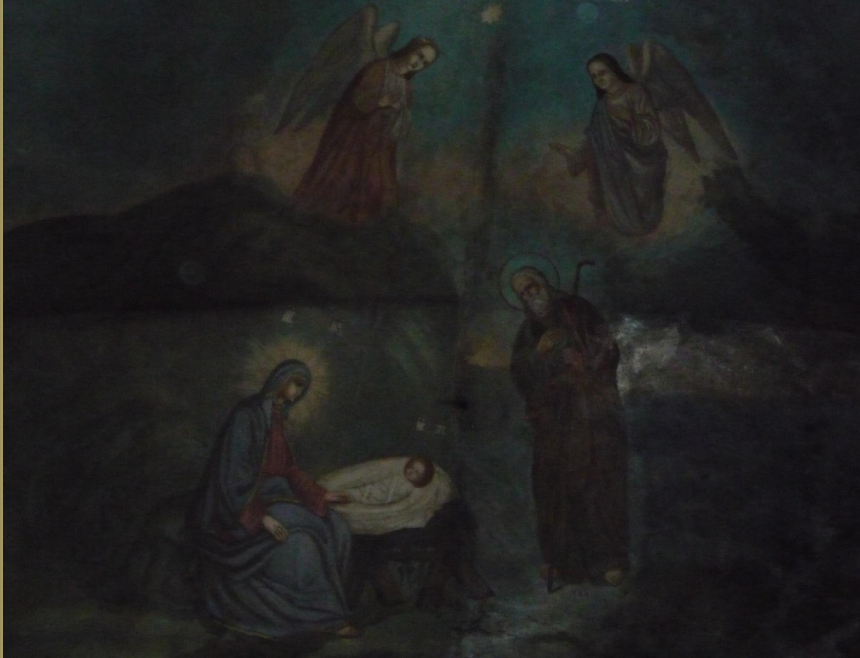
Храмовая икона «Рождество Христово» расположенная над иконостасом