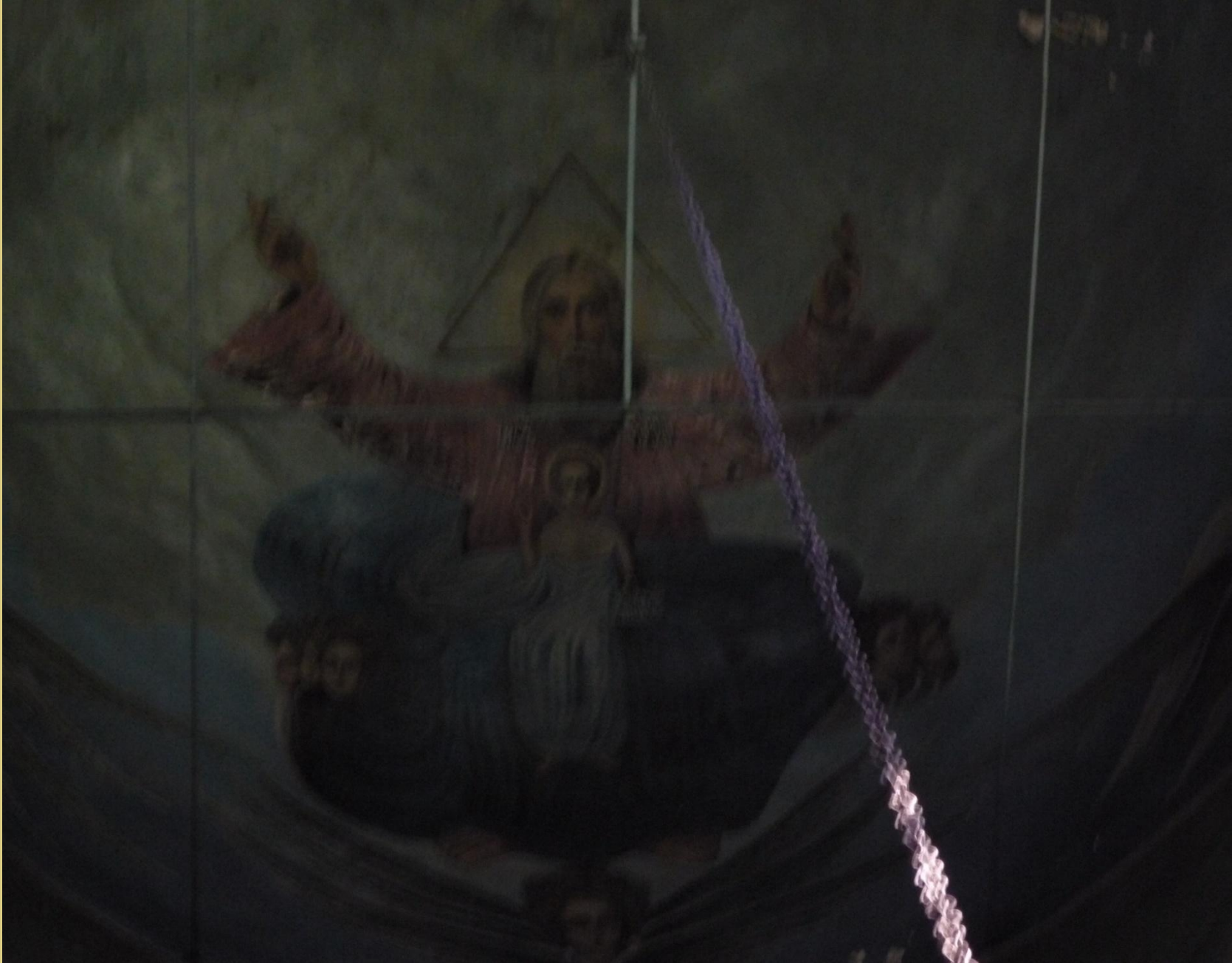
Икона «Бог Саваоф» расположенная в куполе