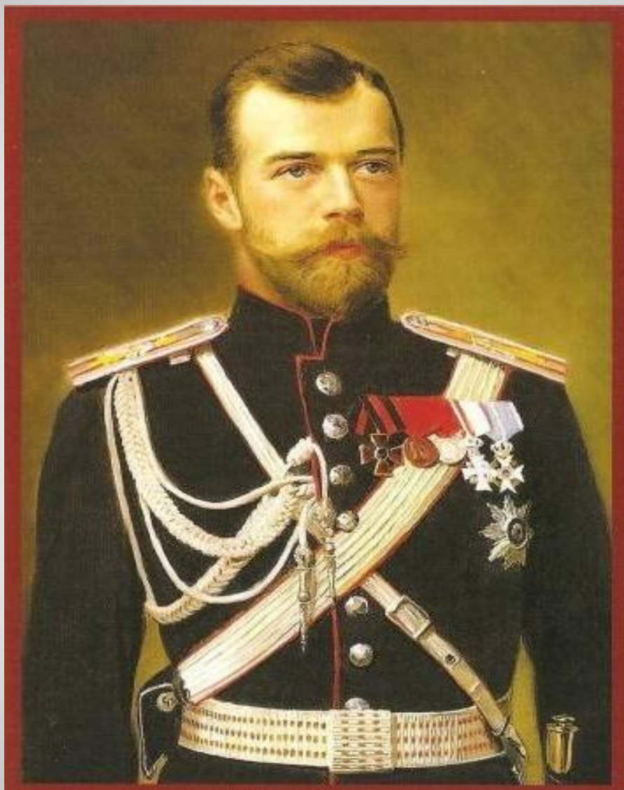
Император Николай II (1868 – 1918)