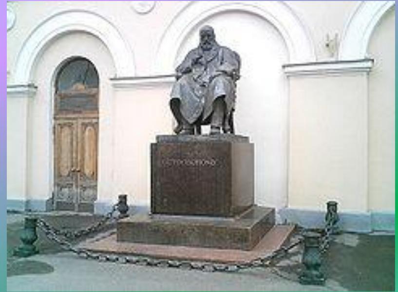
ПАМЯТНИК ОСТРОВСКОМУ У МАЛОГО ТЕАТРА

Детство и юность писателя прошло в Замоскворечье.. Отец женился второй раз на дочери обрусевшего шведского барона, которая не слишком занималась воспитанием детей от первого брака своего мужа. Островский был предоставлен самому себе, ещё в детстве пристрастился к чтению.